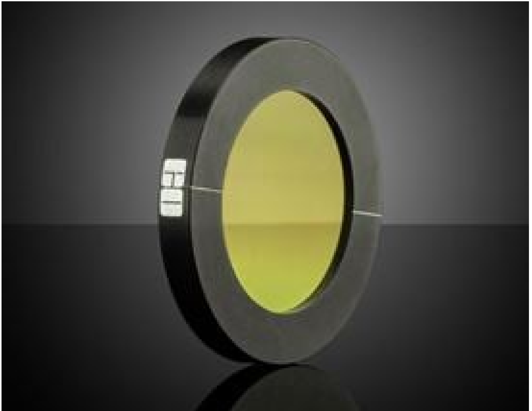
50mm Dia. KRS-5, IR Holographic Wire Grid Polarizer, #62-775