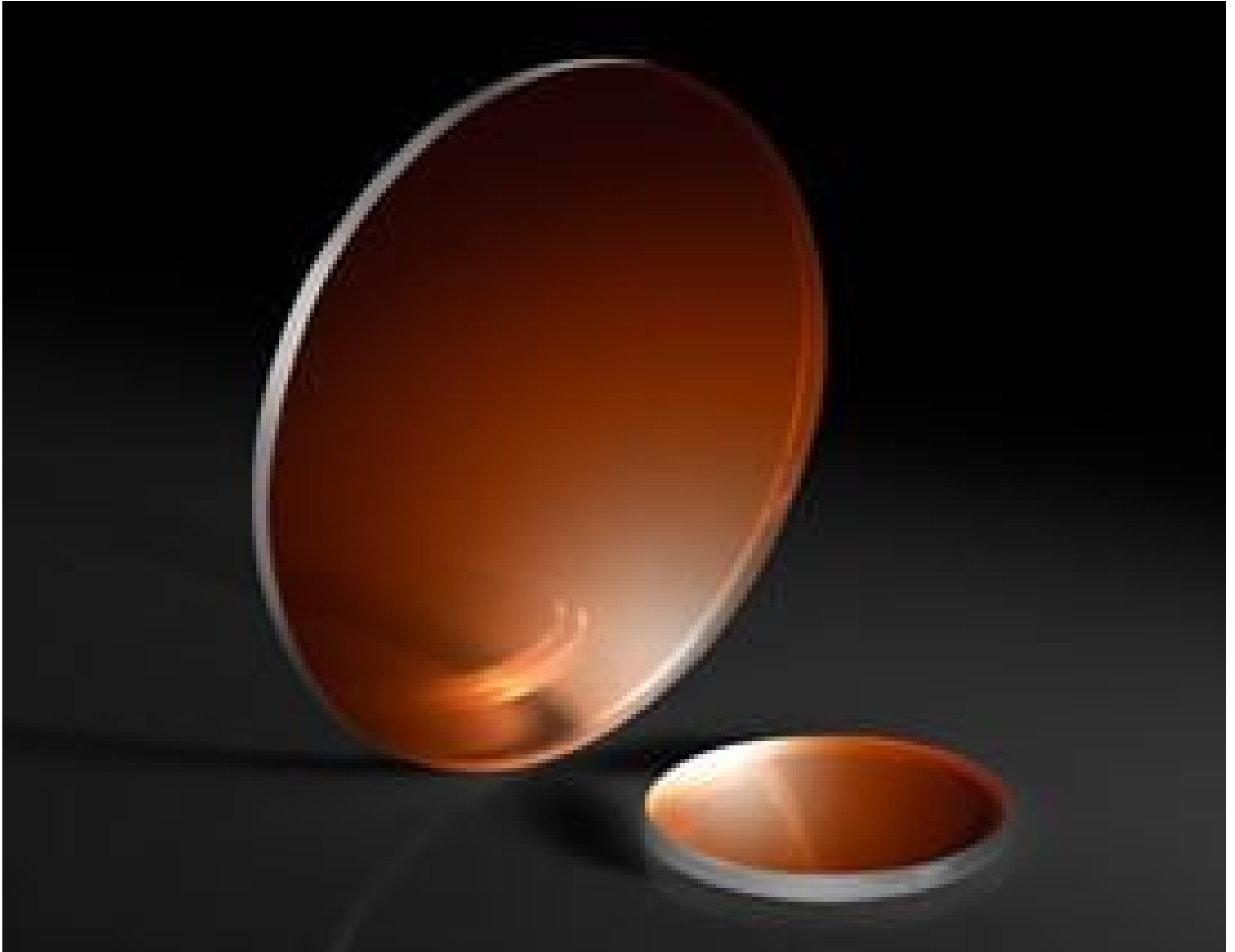
Lithium Fluoride (LiF) Windows