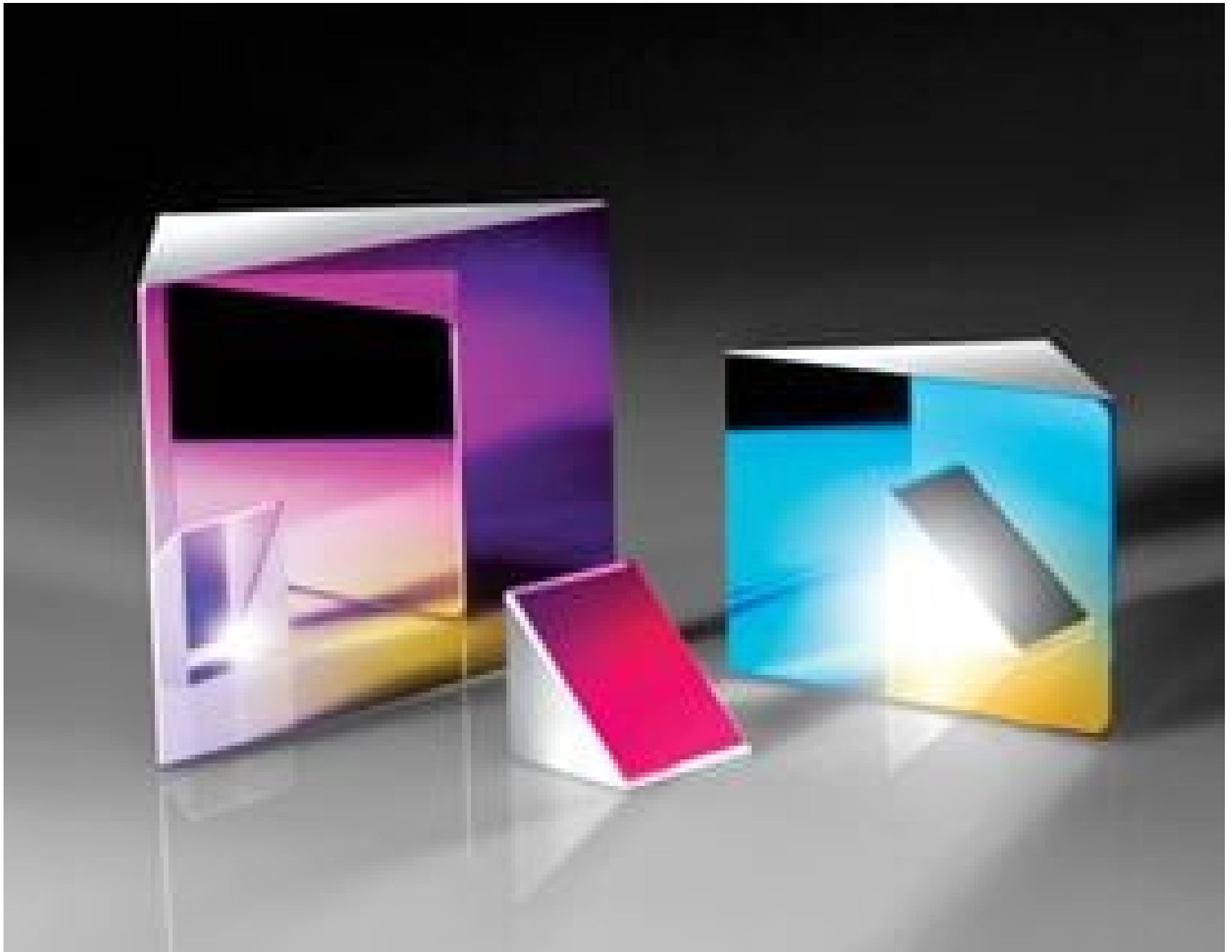
Broadband Dielectric Coated Right Angle Mirrors