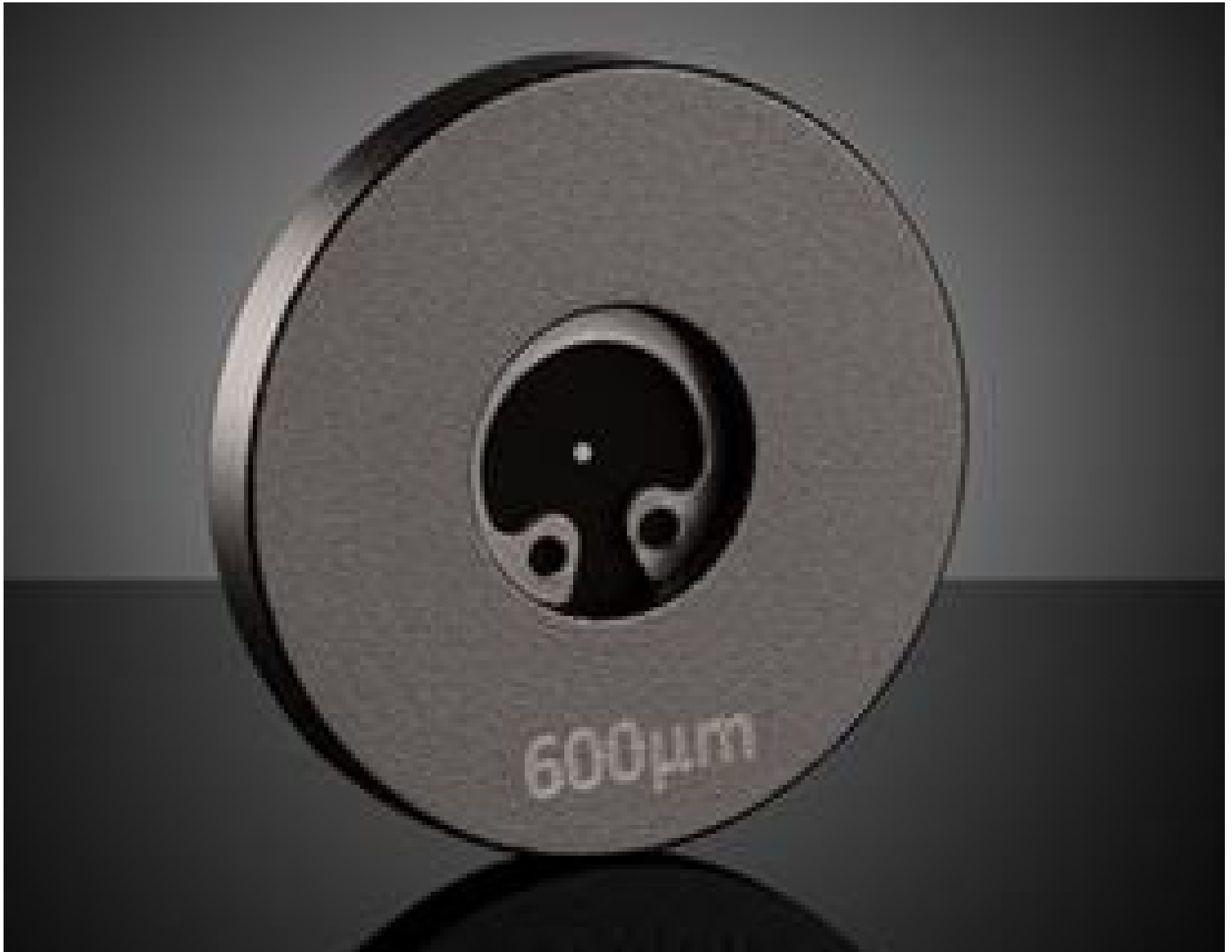
Acktar Blackened Pinholes (mounted)