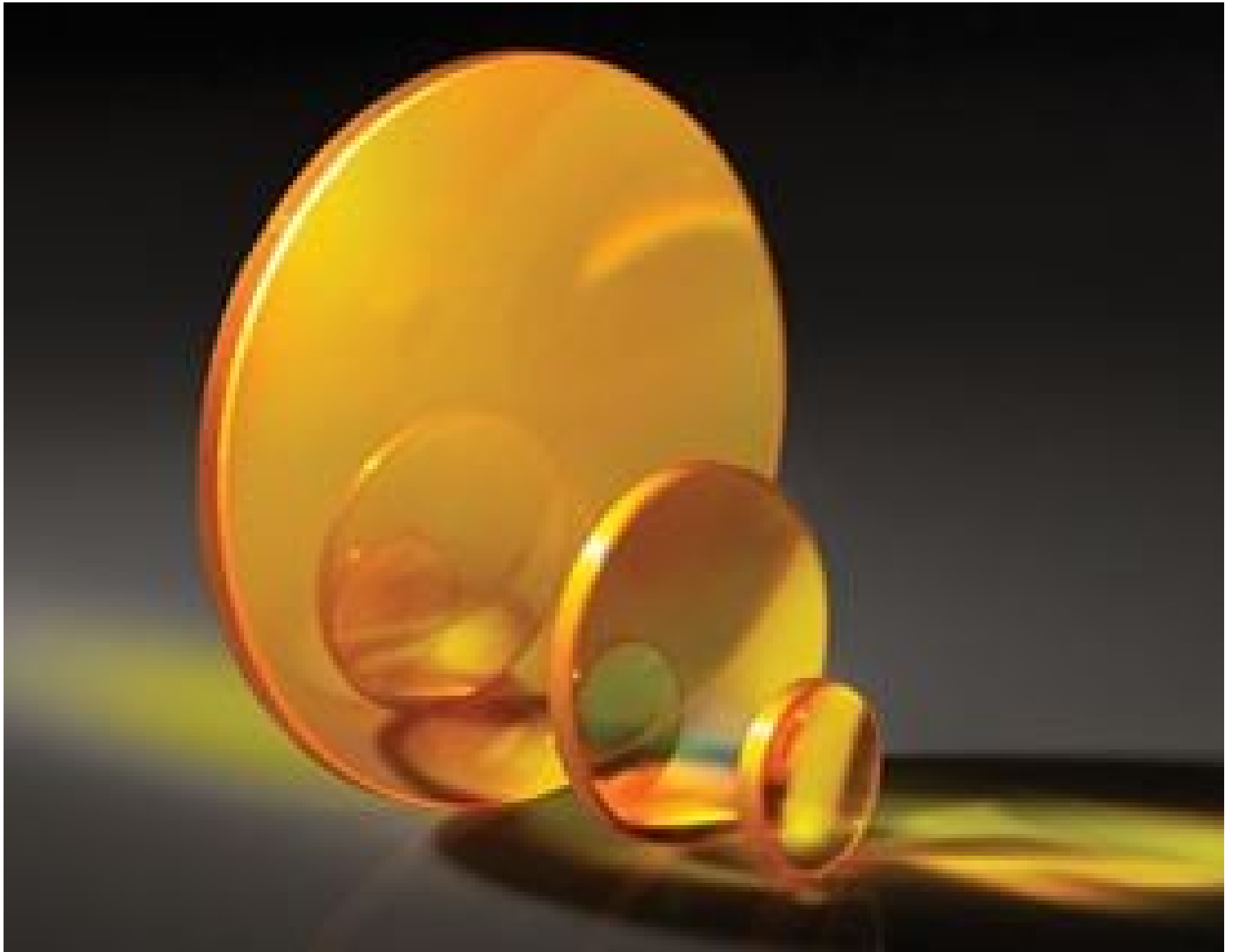
TECHSPEC Zinc Selenide (ZnSe) Plano-Convex (PCX) Lenses