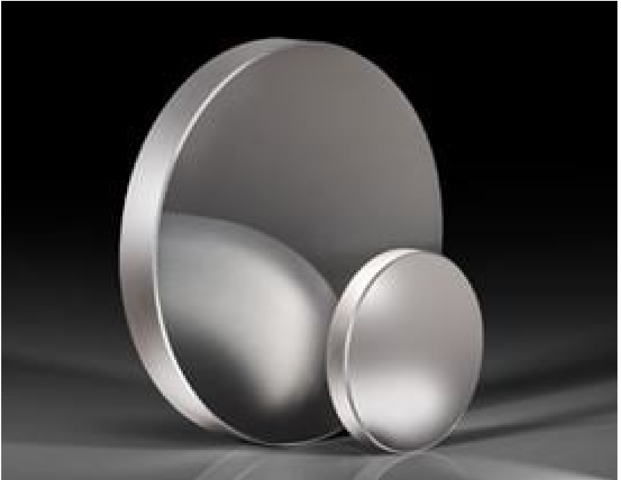
TECHSPEC® Ultrafast-Enhanced Silver Concave Laser Mirrors