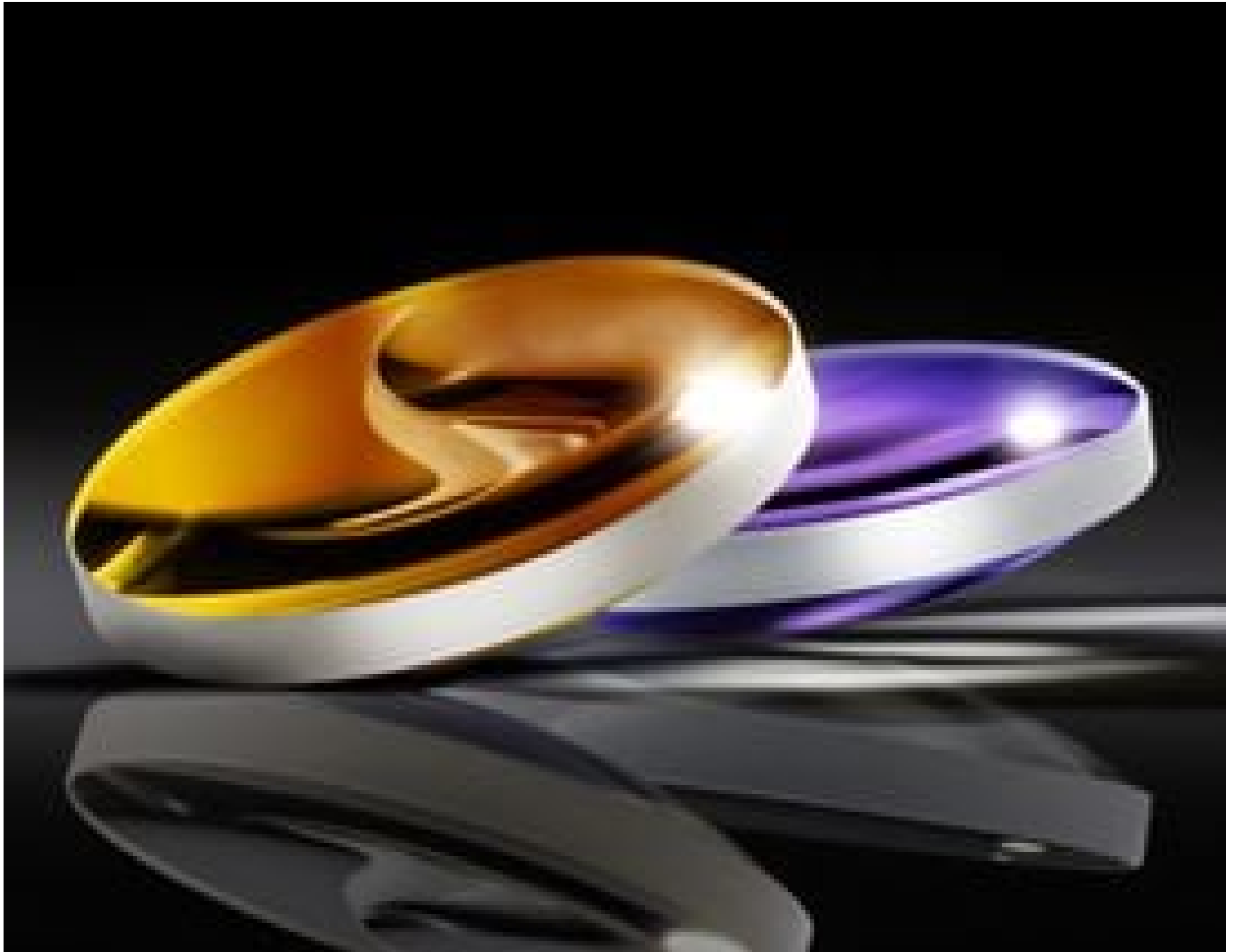
High Precision Laser Grade Aspheric Lenses