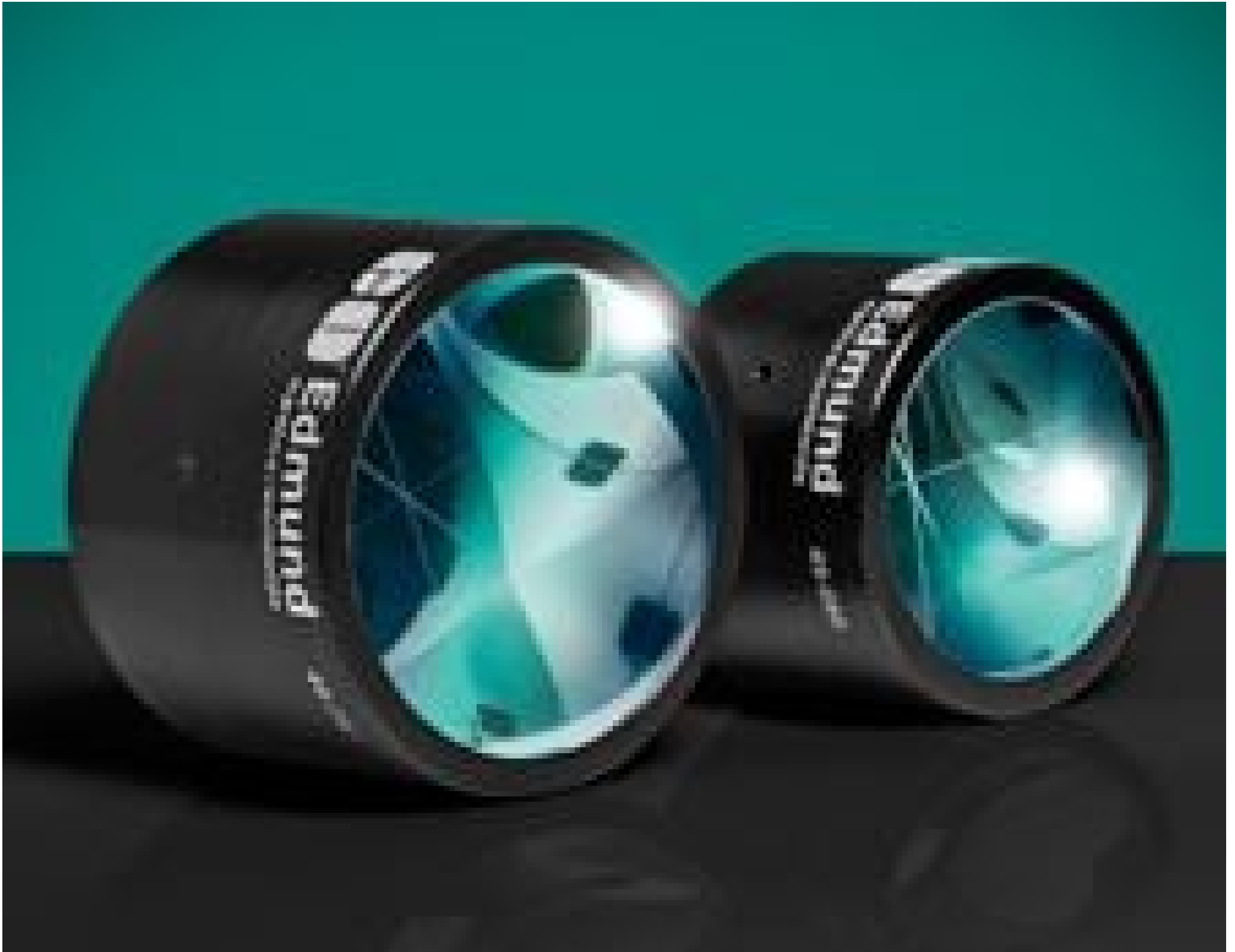
Mounted Fused Silica Corner Cube Retroreflectors