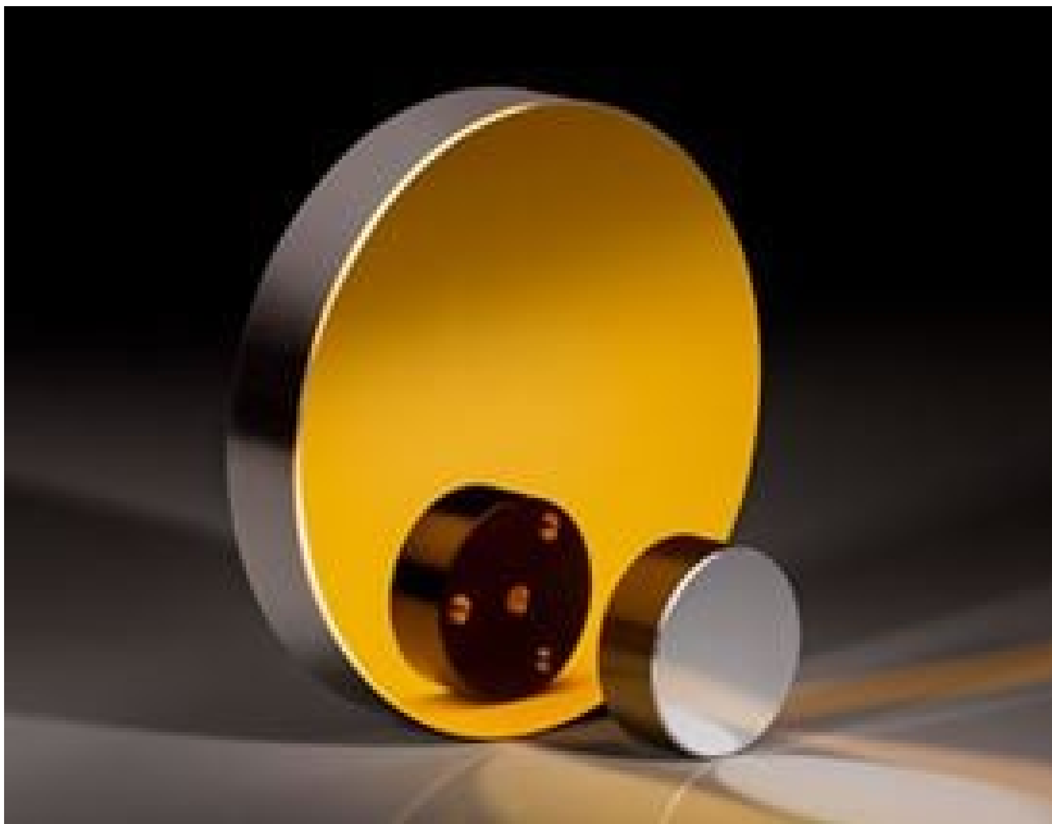
Metal Substrate Mirrors