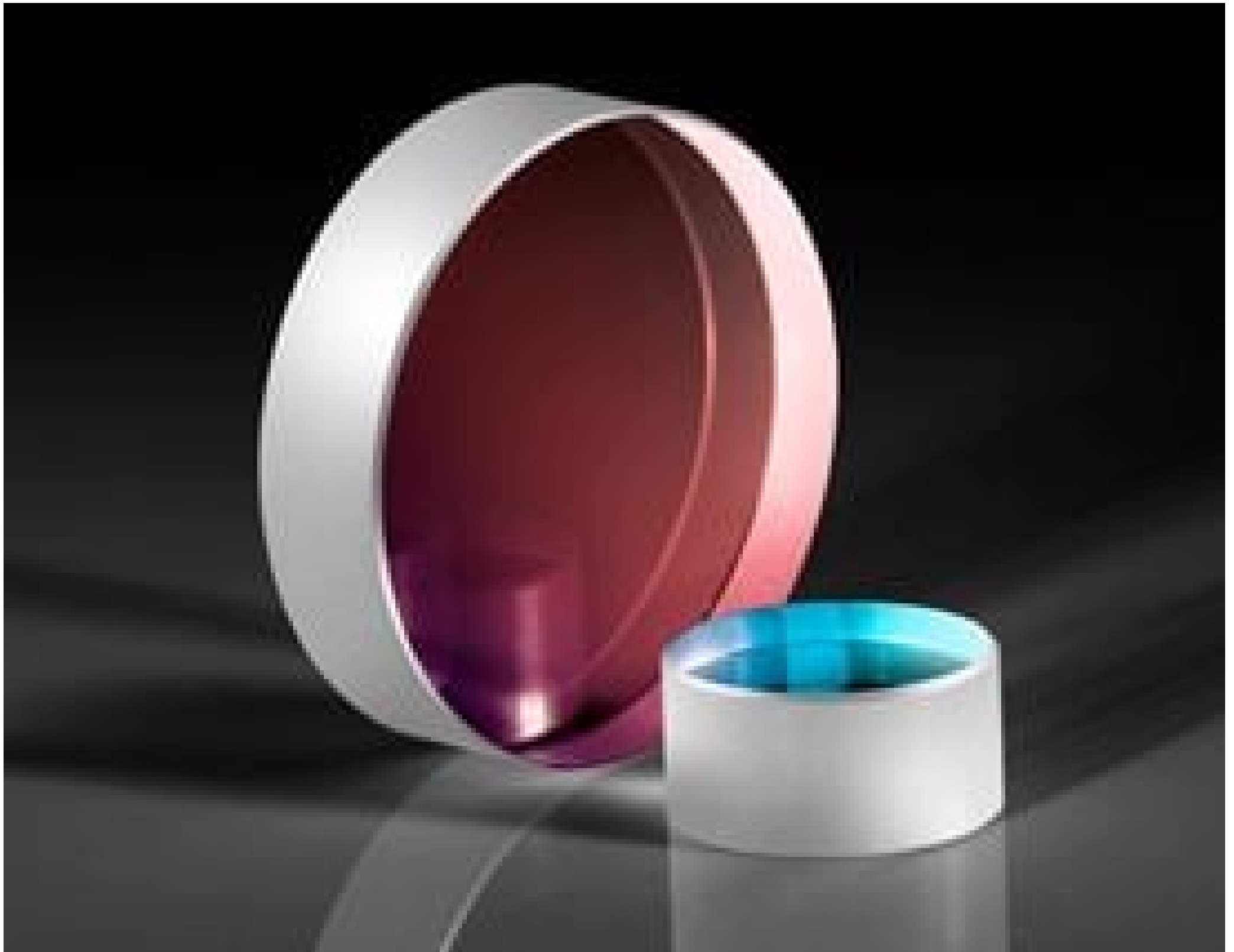
\lambda/10 Ultra-Low Reflectivity Windows