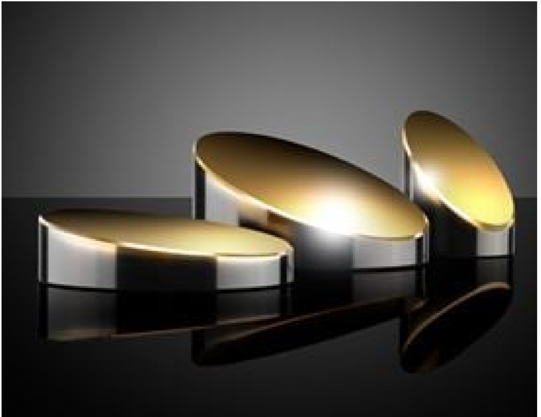
TECHSPEC Gold Off-Axis Parabolic Mirrors