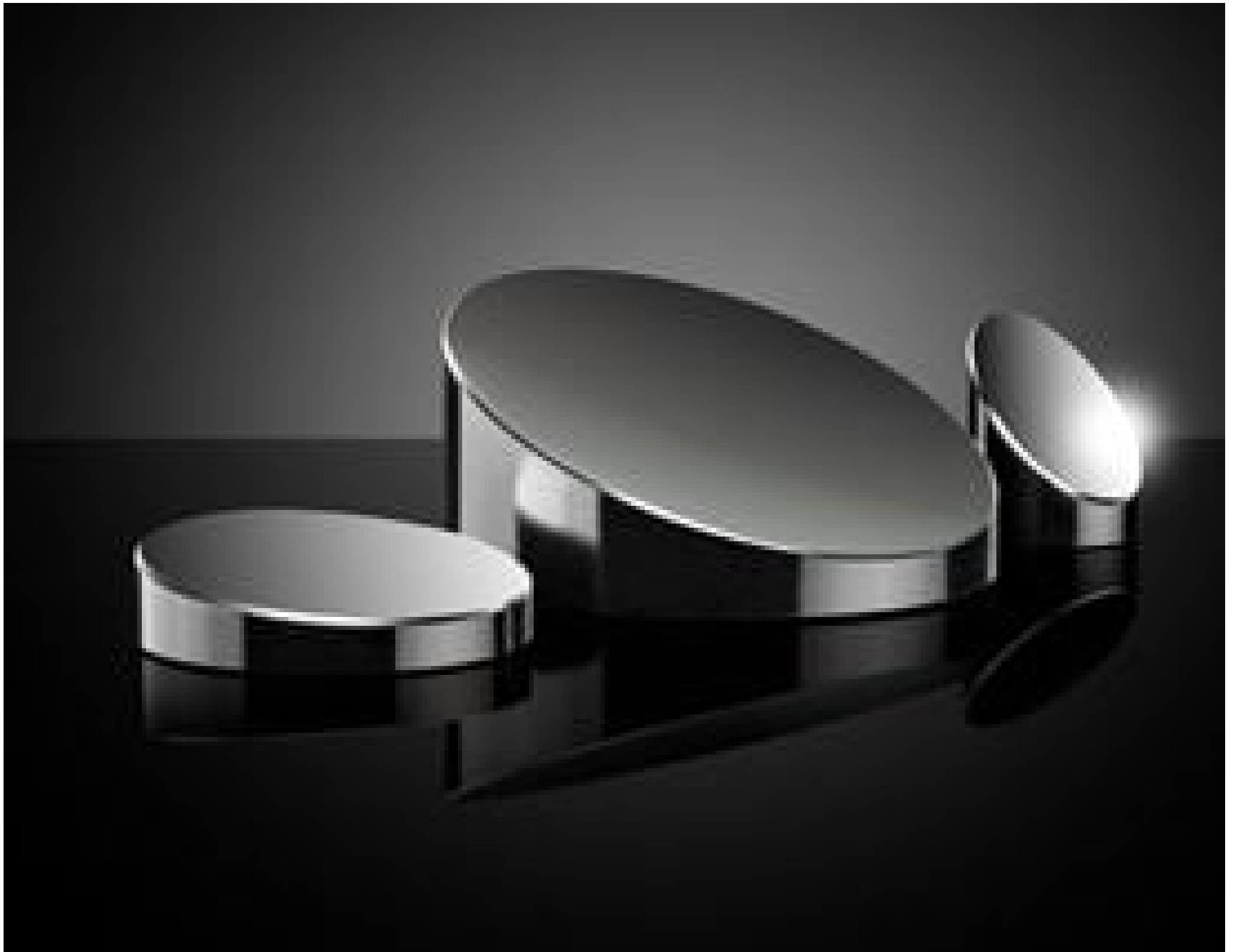
Miroirs Paraboliques Hors Axe, Traités Aluminium