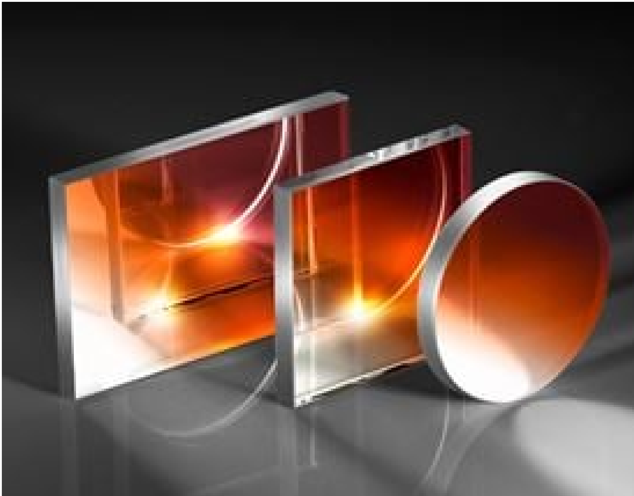
Visible and NIR Plate Beamsplitters