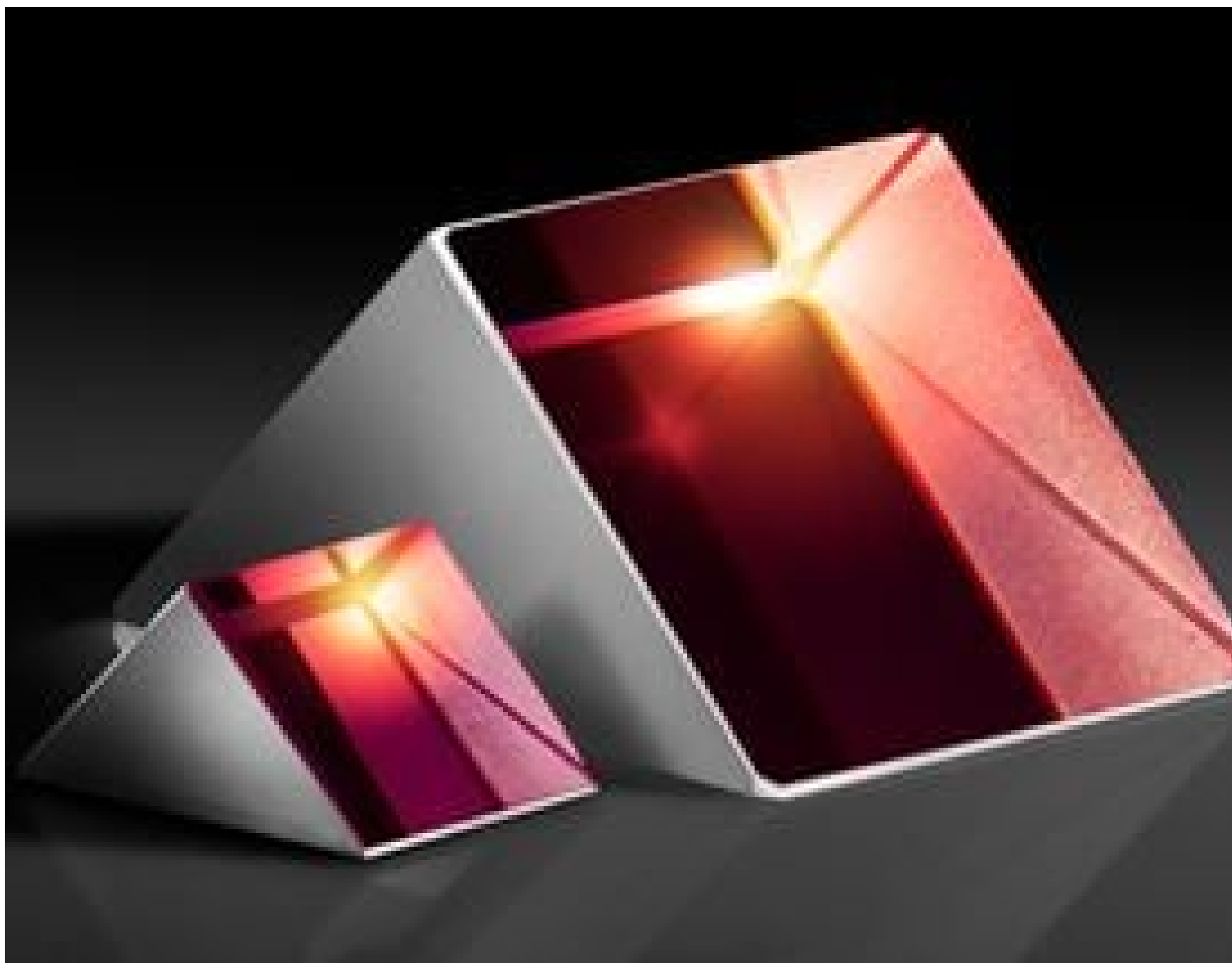
N-SF11 Right Angle Prisms