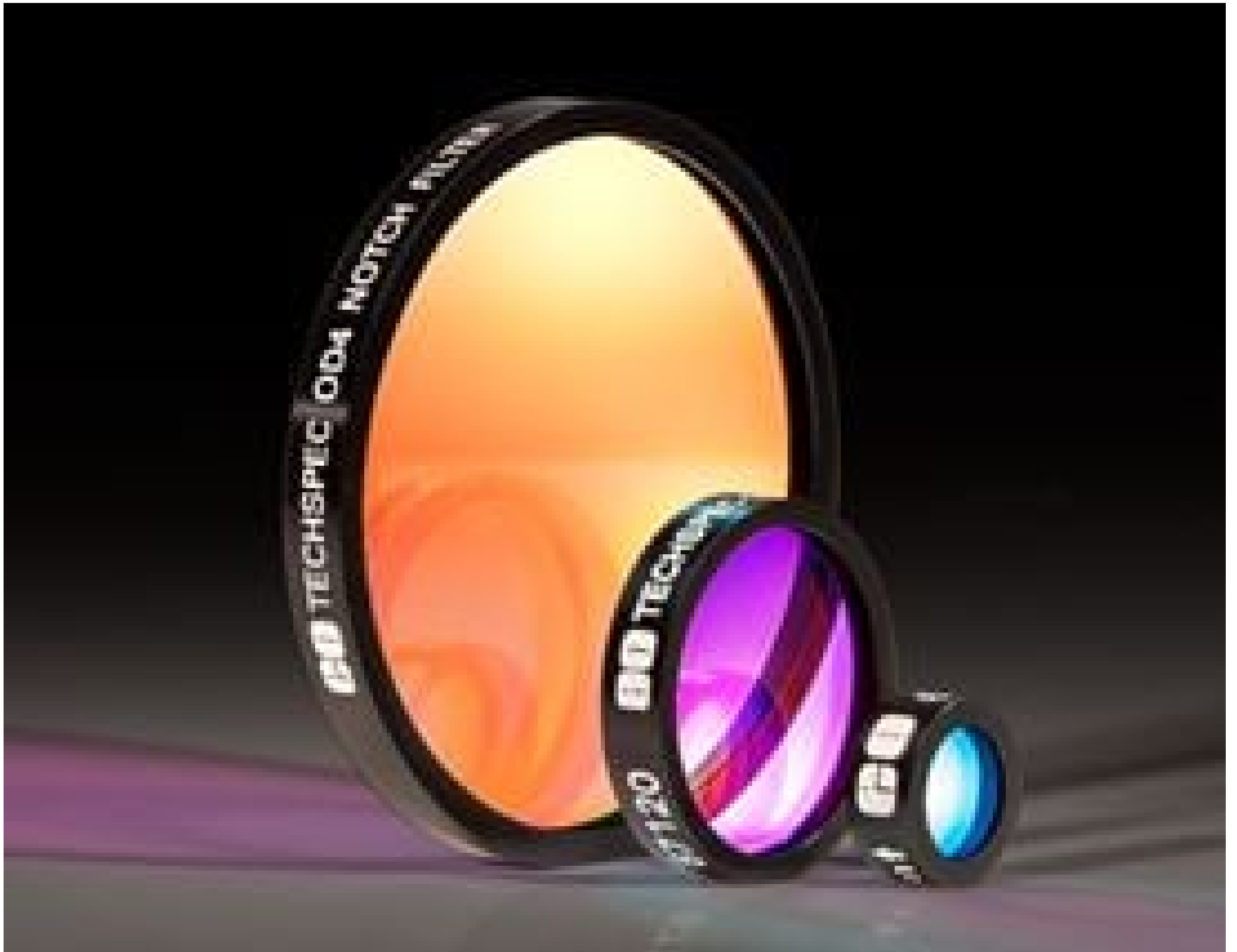
TECHSPEC OD 4.0 Notch Filters