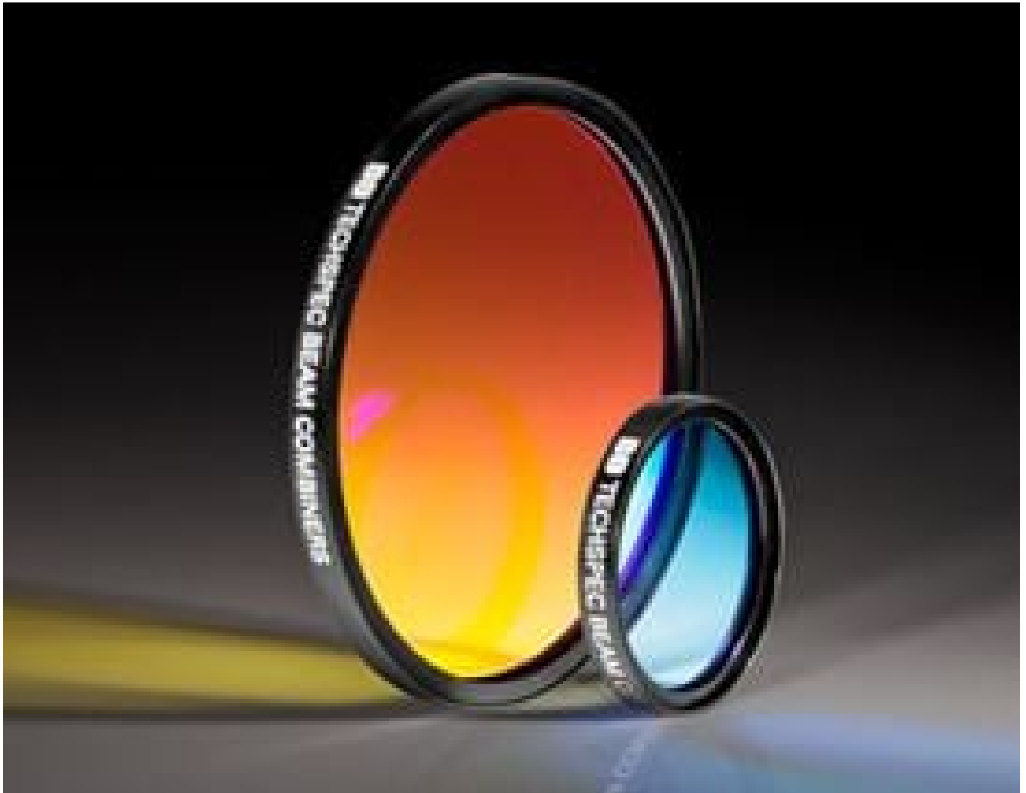
TECHSPEC® Dichroic Laser Beam Combiners