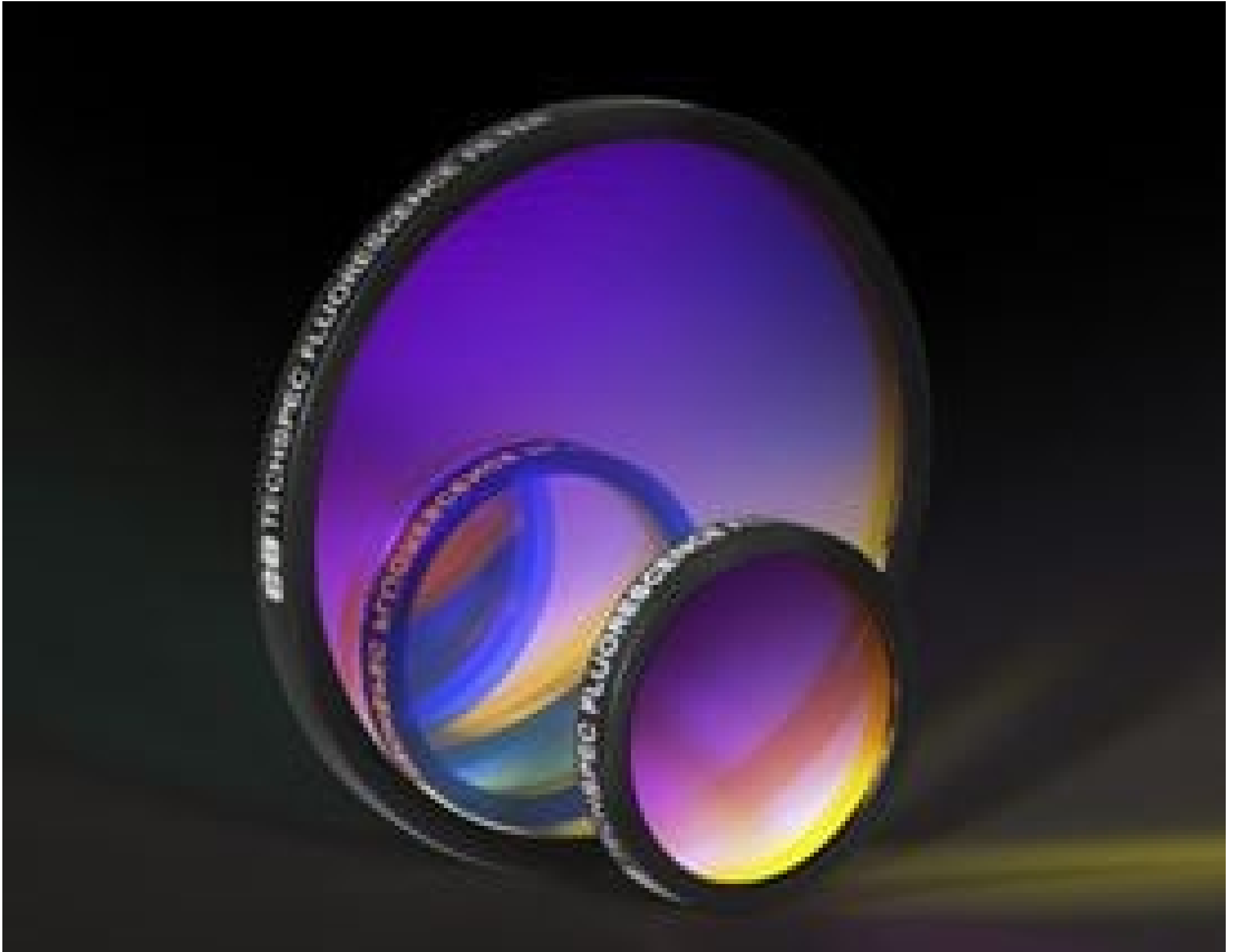
Multi-Band Fluorescence Bandpass Filters