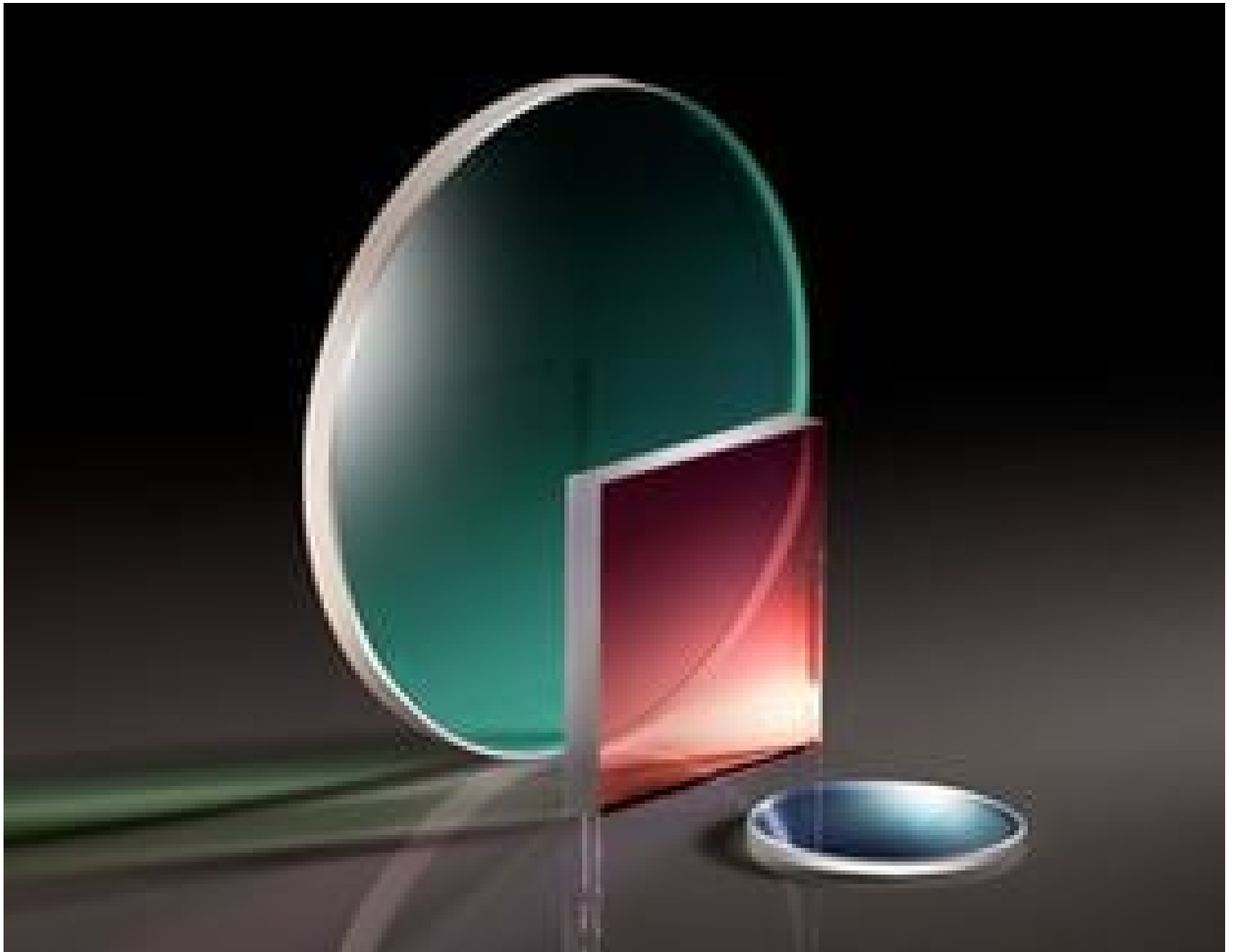
TECHSPEC High Performance Hot Mirrors