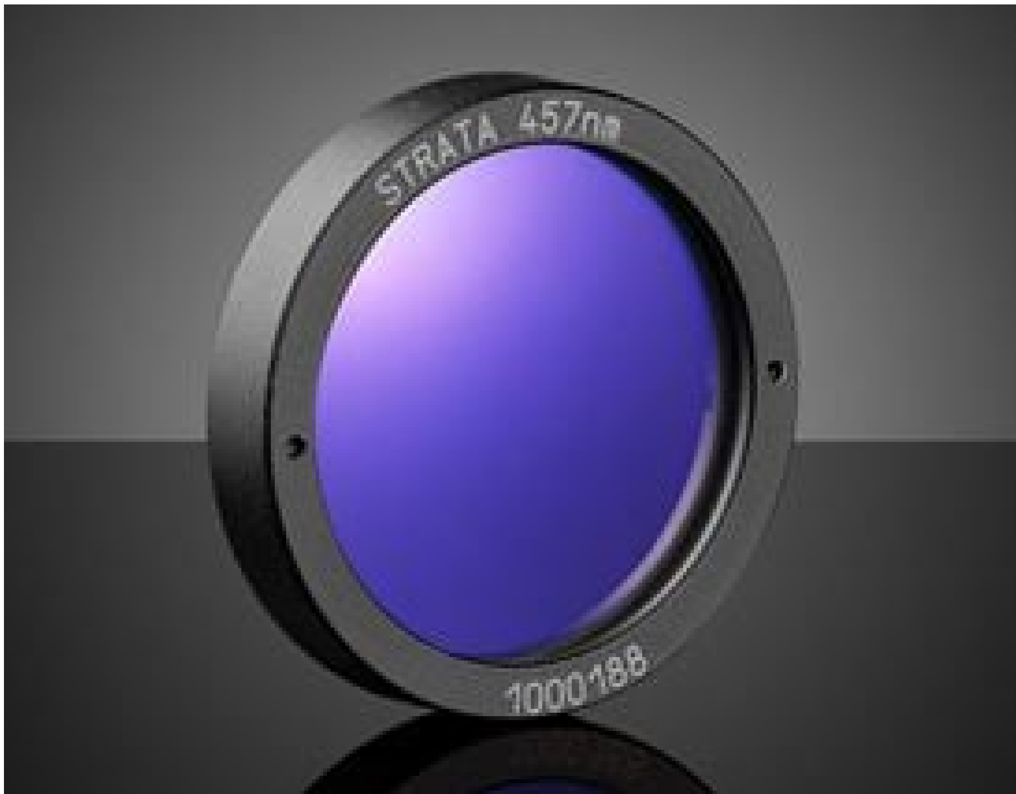
25.4mm META ® holoOPTIX ® STRATA Notch Filter