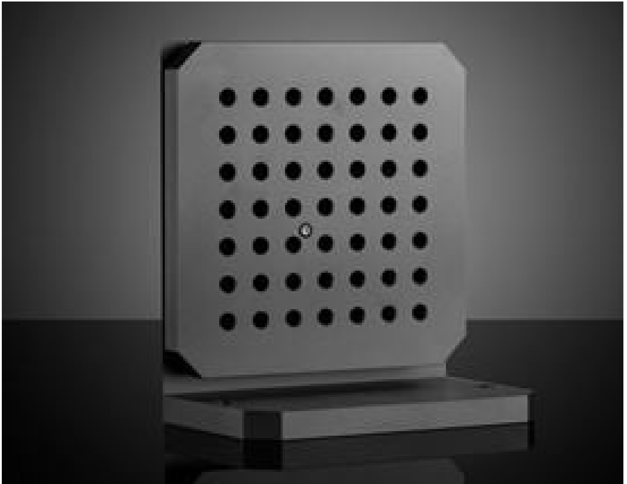
4.5" Angle Mirror Mount