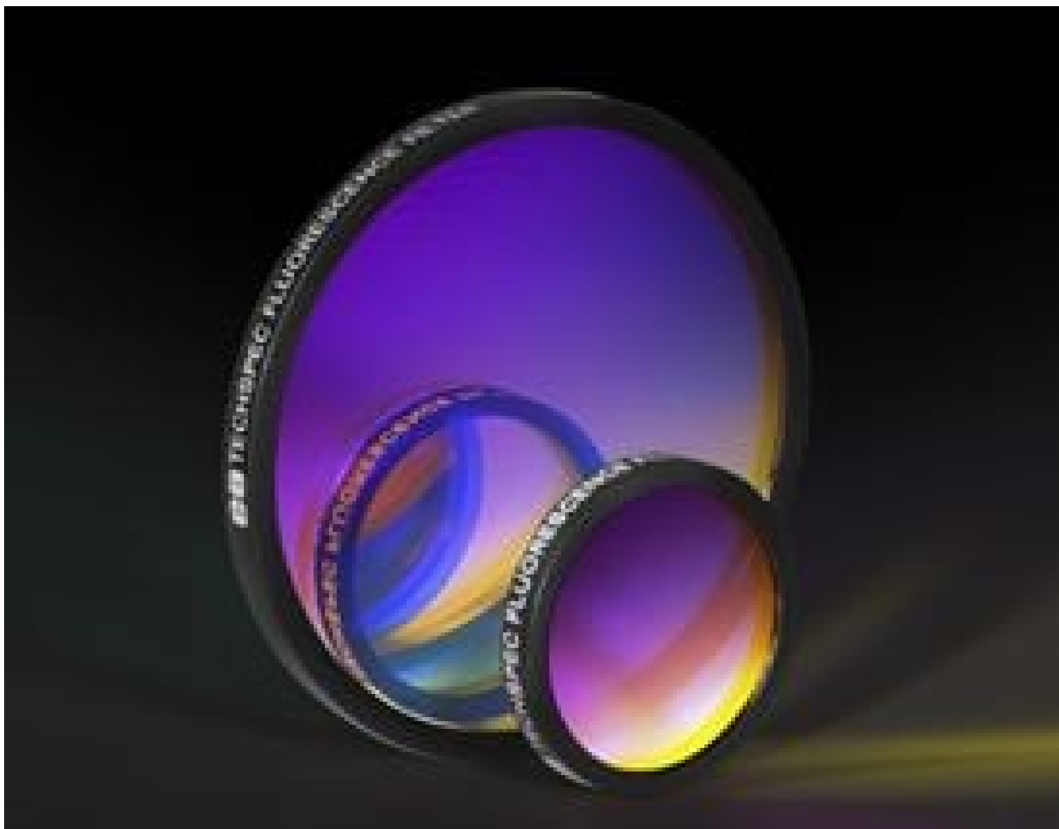
Multi-Band Fluorescence Bandpass Filters