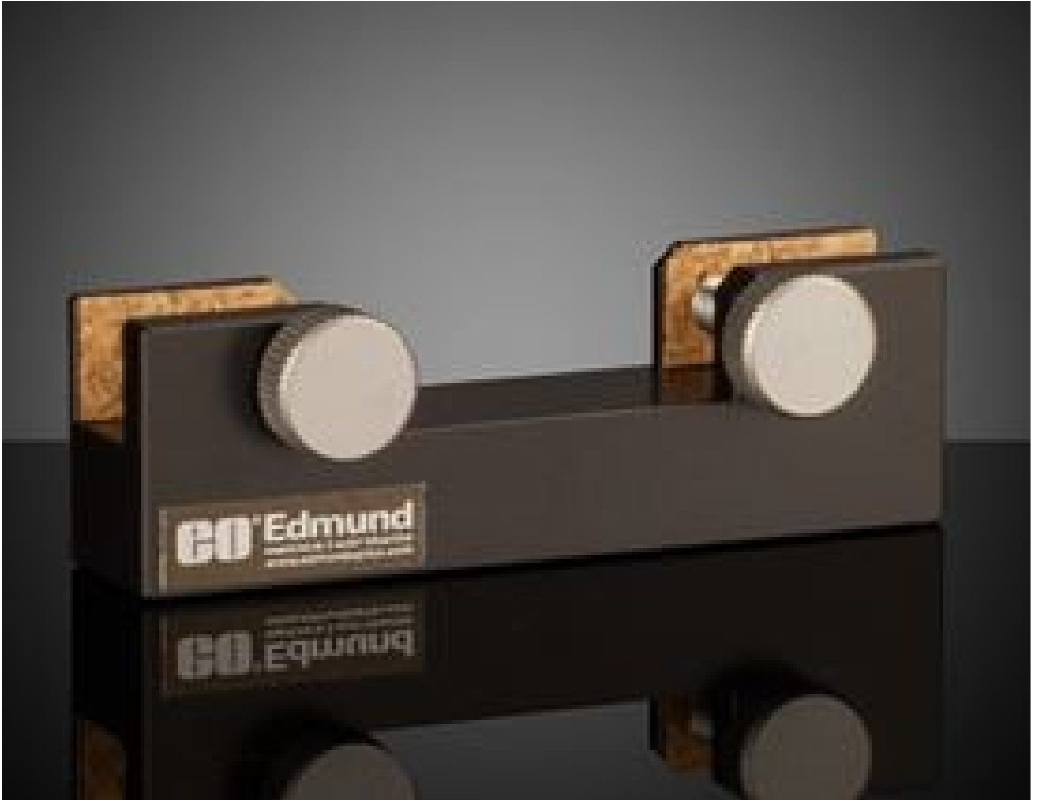
40mm Sq., Fixed Filter Holder