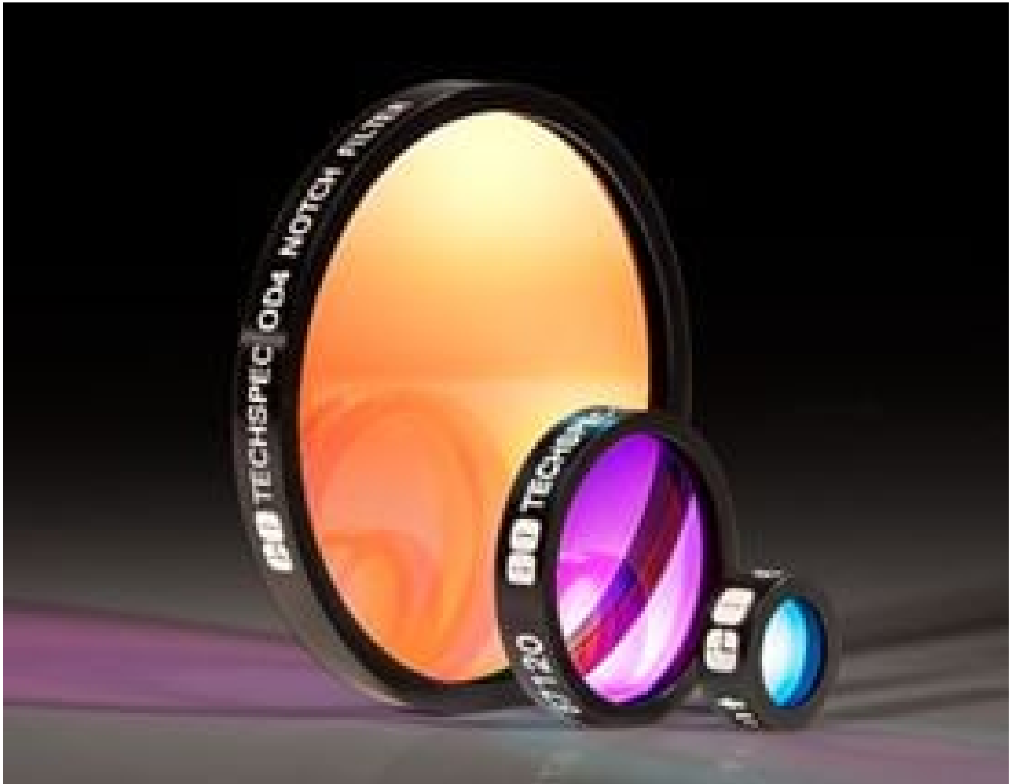
TECHSPEC OD 4.0 Notch Filters