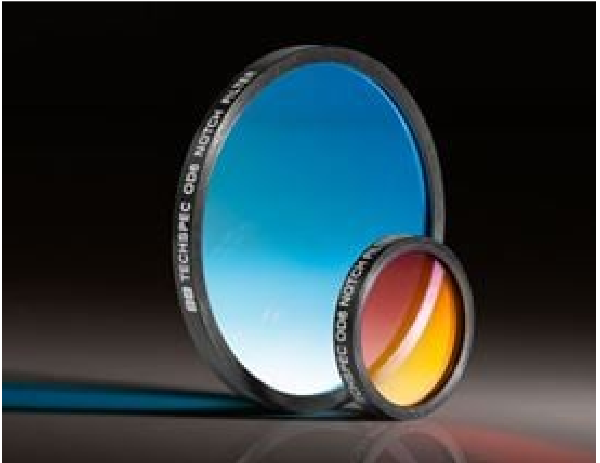
TECHSPEC OD 6.0 Notch Filters