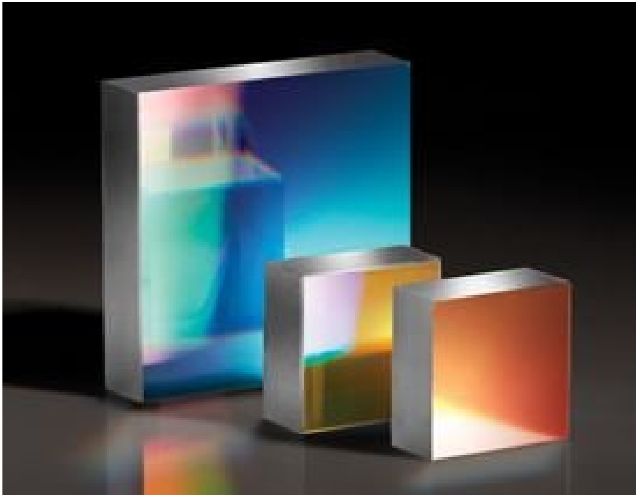
Richardson Gratings™ High Precision Plane Ruled Reflective Diffraction Gratings