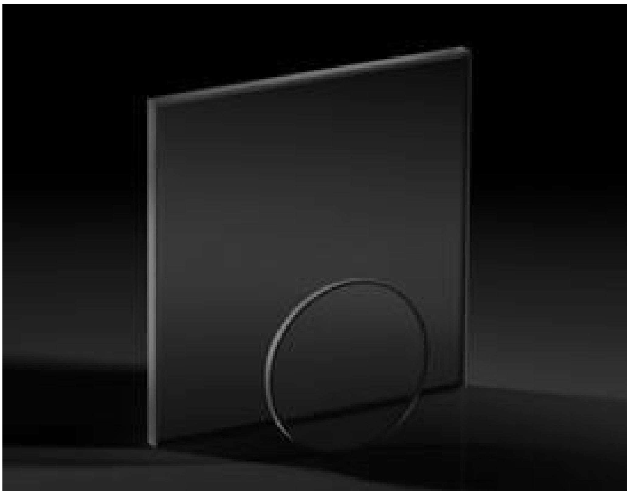
Precision Absorptive Neutral Density (ND) Filters