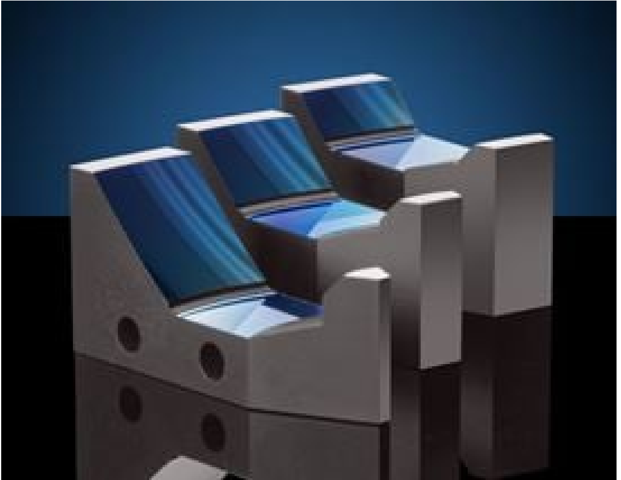
TECHSPEC® Canopus™ Reflective Beam Expanders