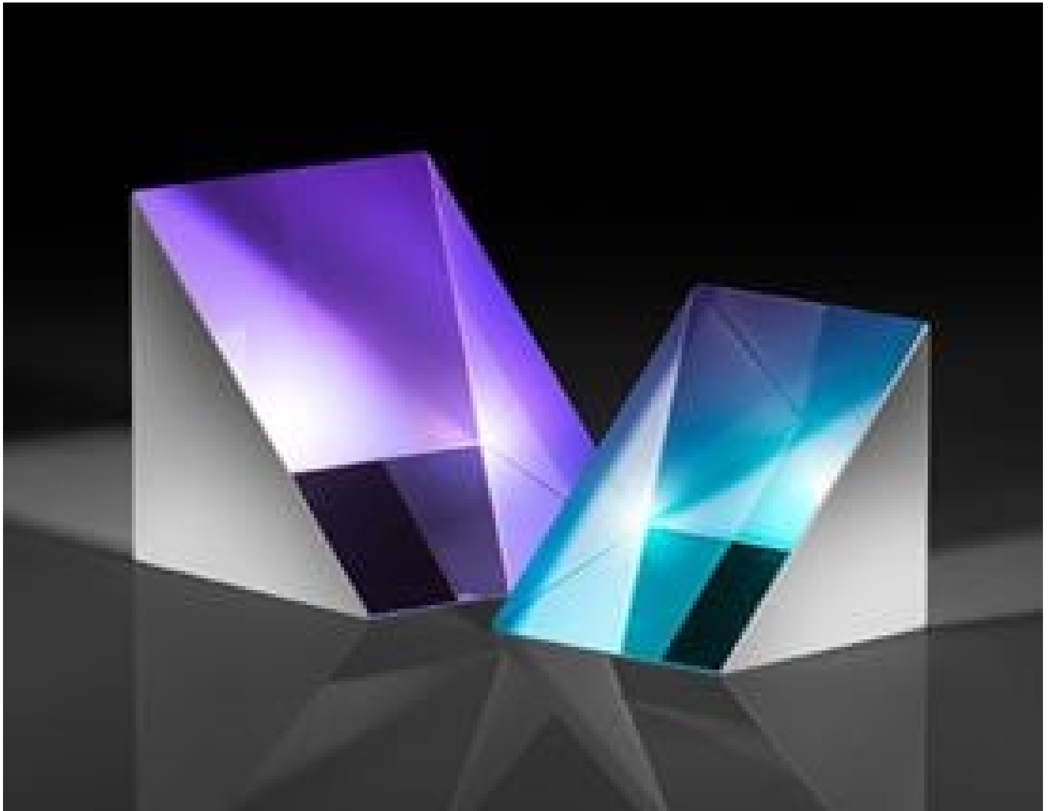
N-BK7 Right Angle Prisms