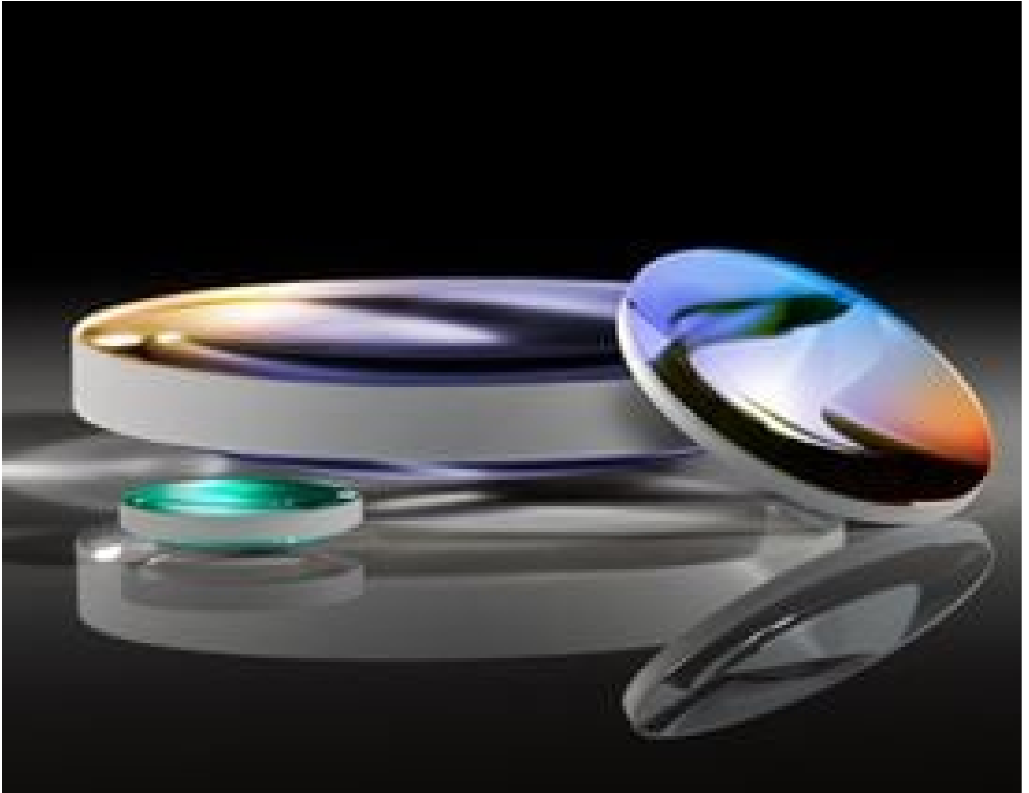
YAG-BBAR Coated Plano-Convex (PCX) Lenses