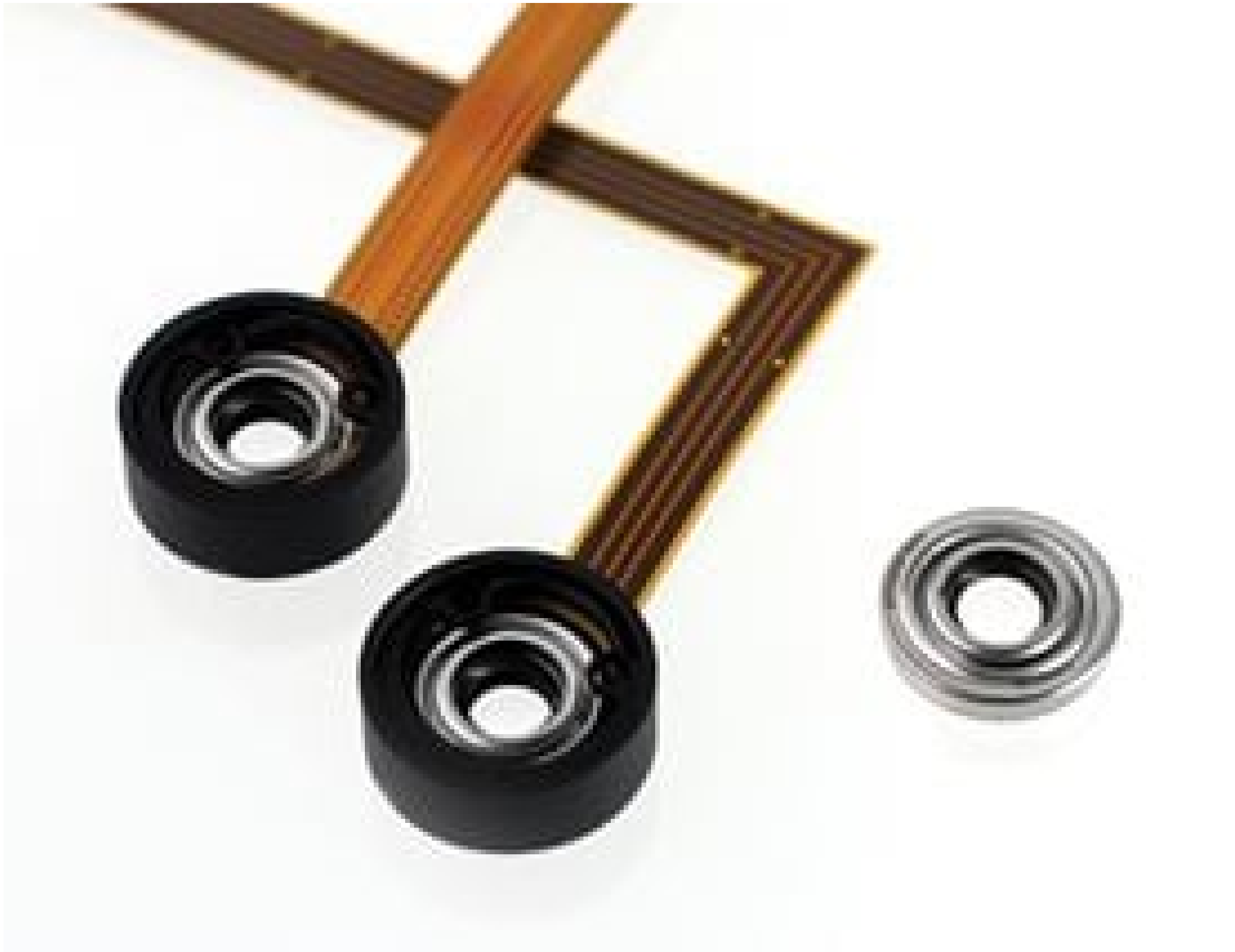
Corning® Varioptic® Variable Focus Liquid Lenses