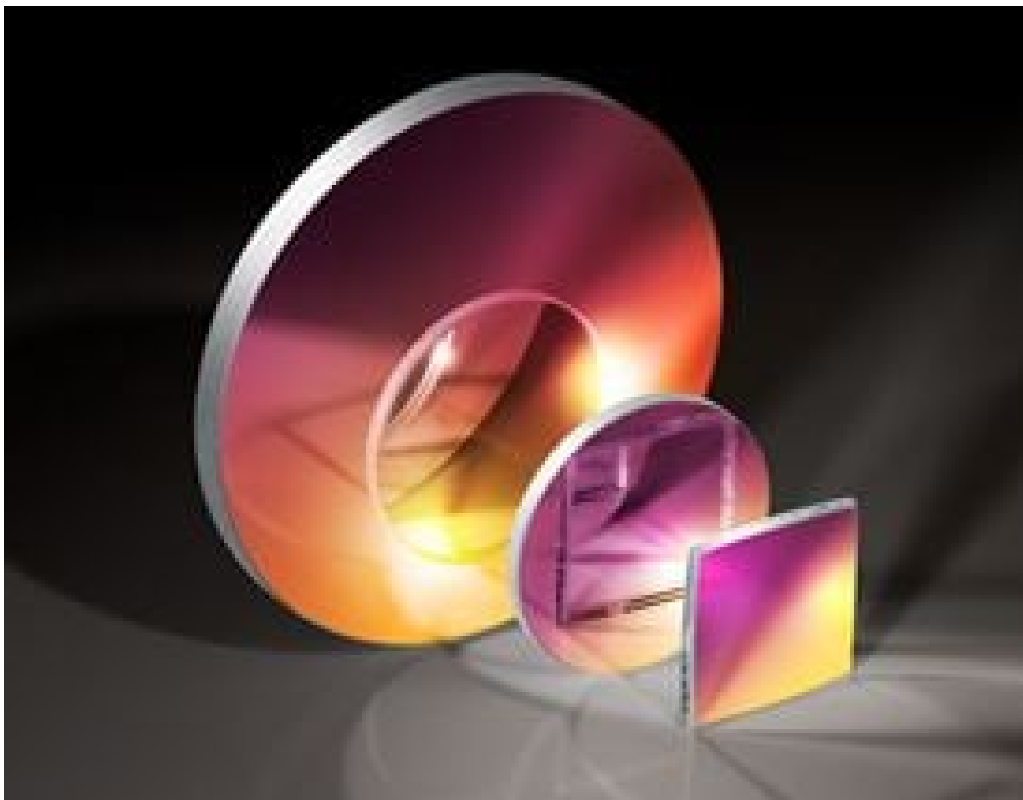
4-6 \lambda First Surface Mirrors