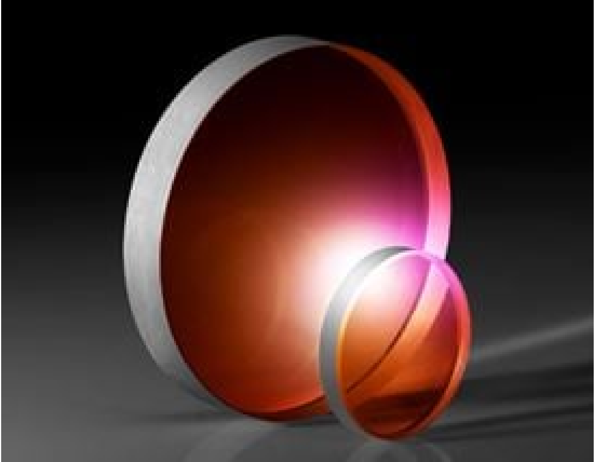
Calcium Fluoride (CaF 2 ) Wedged Windows