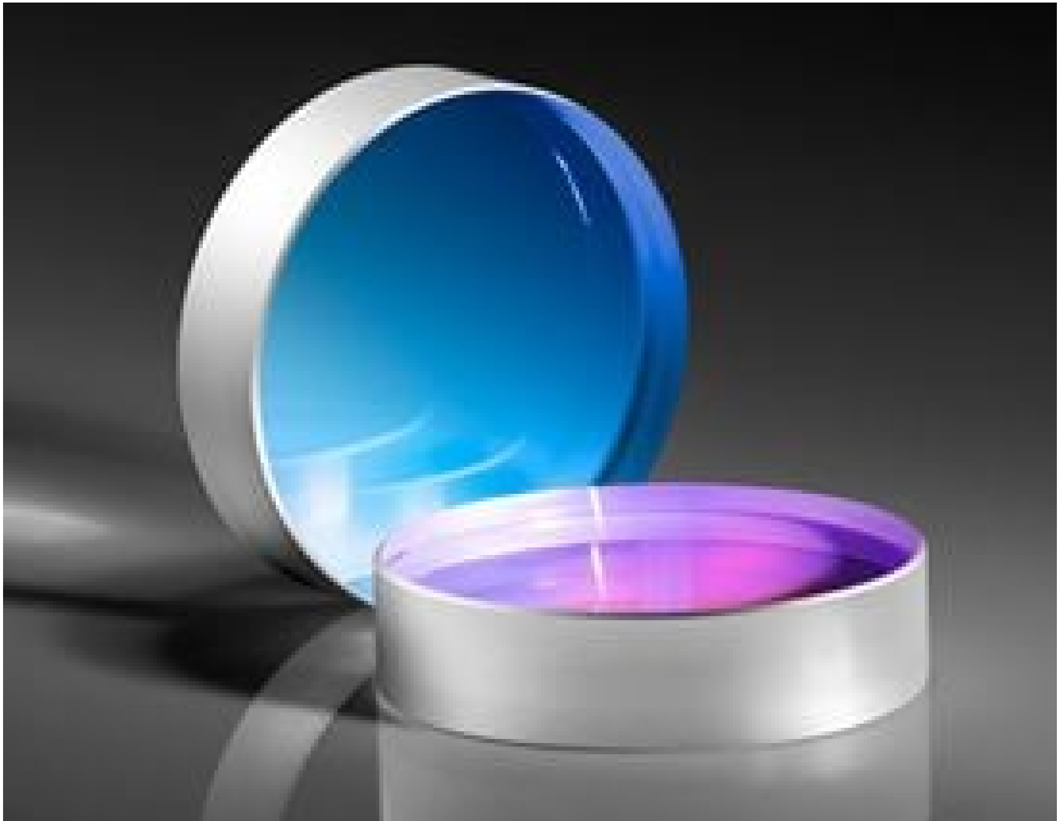
TECHSPEC® Nd:YAG Laser Line Beam Samplers