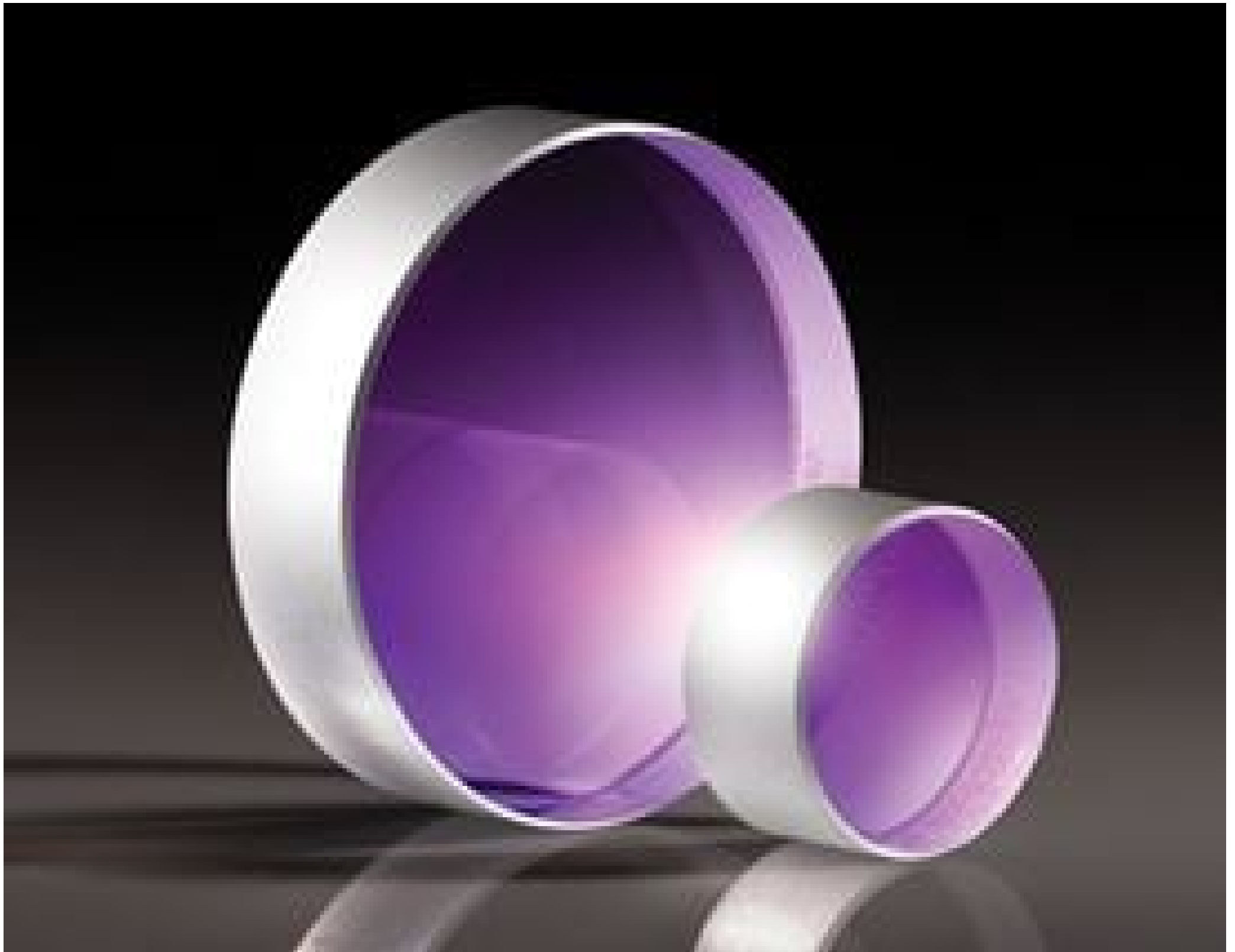
TECHSPEC N10 Laser Line Coated Windows