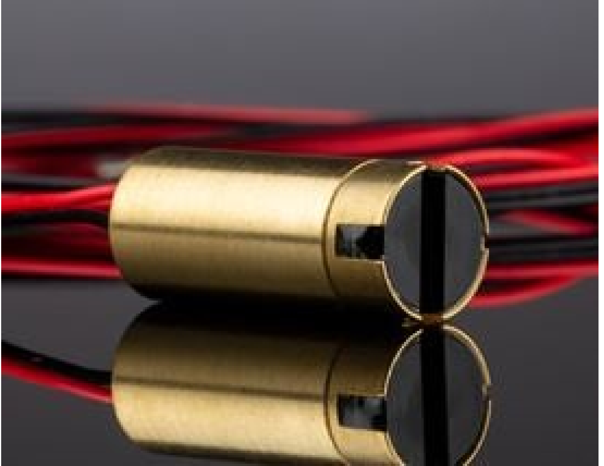
Coherent® Micro VLM™ Laser Diode - Line Option