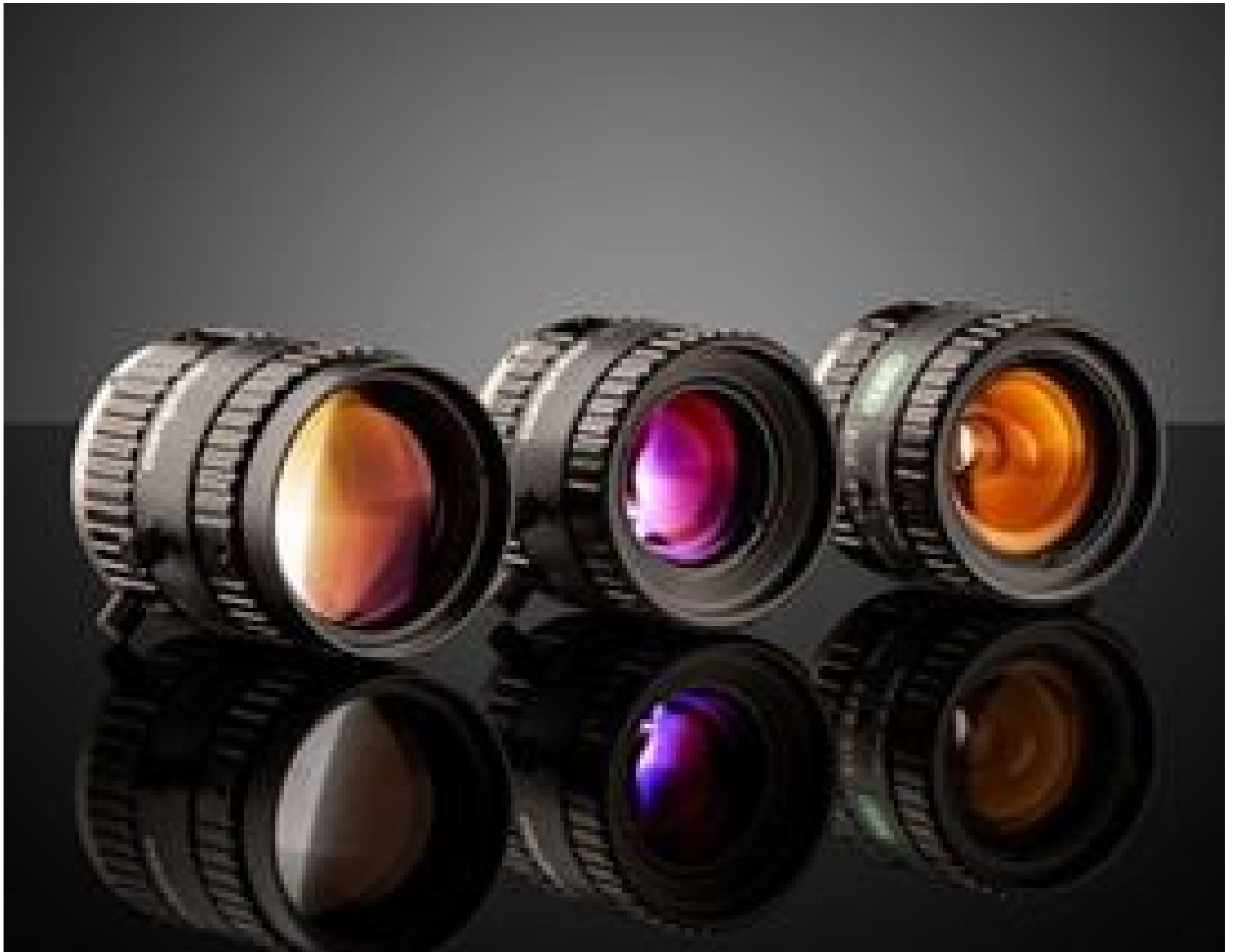
MegaPixel Fixed Focal Length Lenses