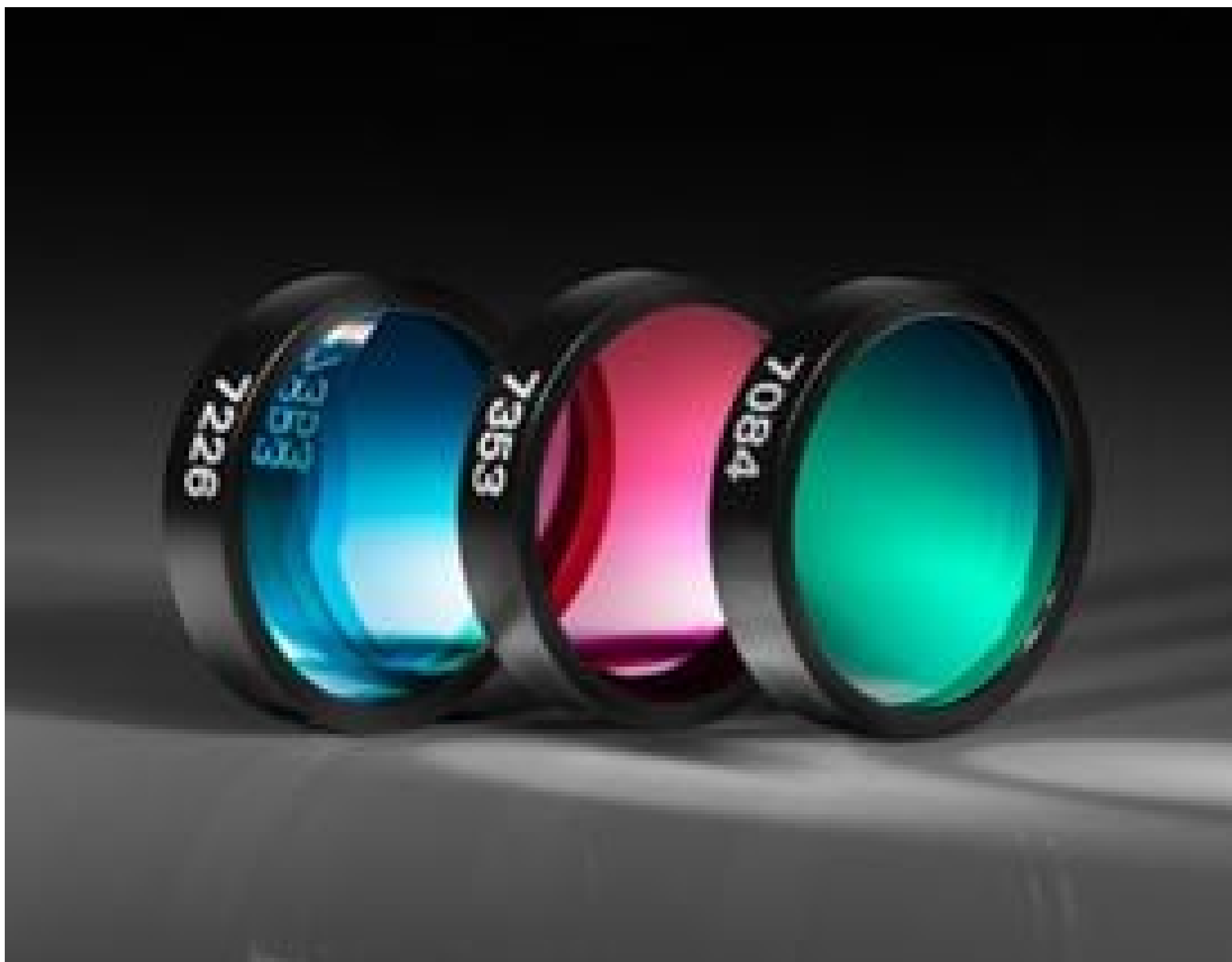
Ultra Narrow Bandpass Filters