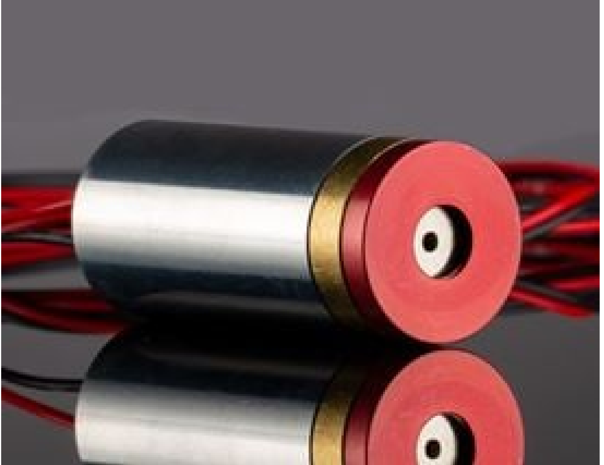
Coherent® VHK™ Circular Beam Visible Laser Diode