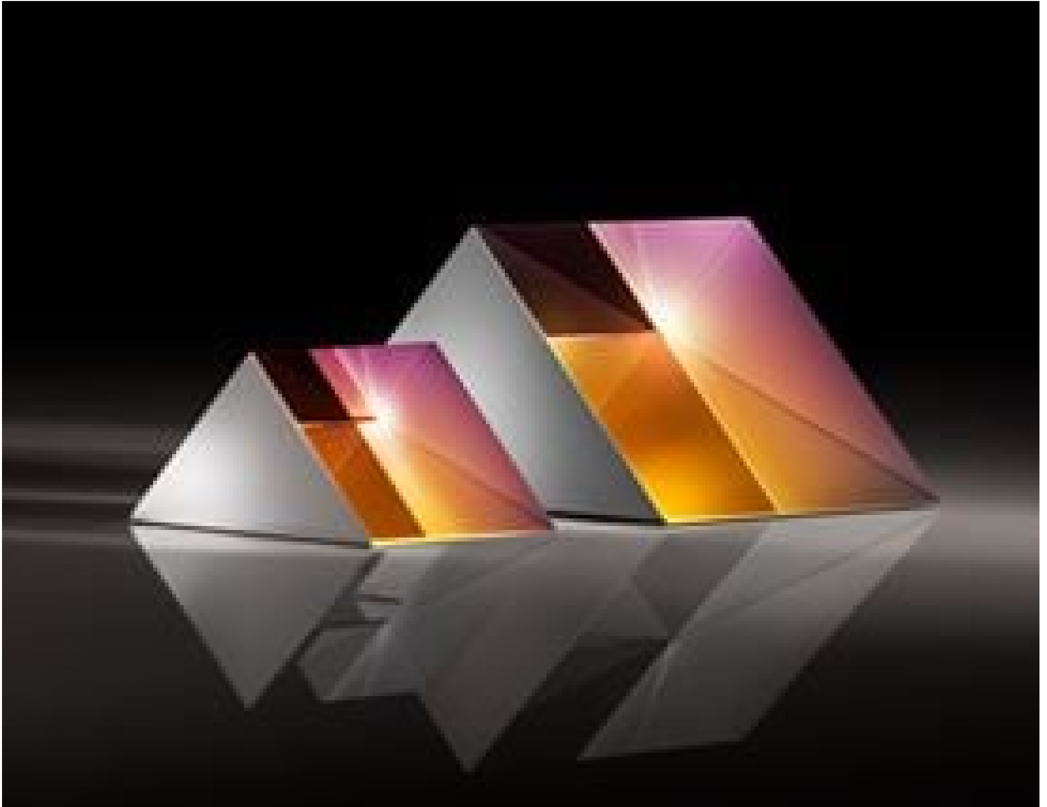
TECHSPEC UV Fused Silica Right Angle Prisms