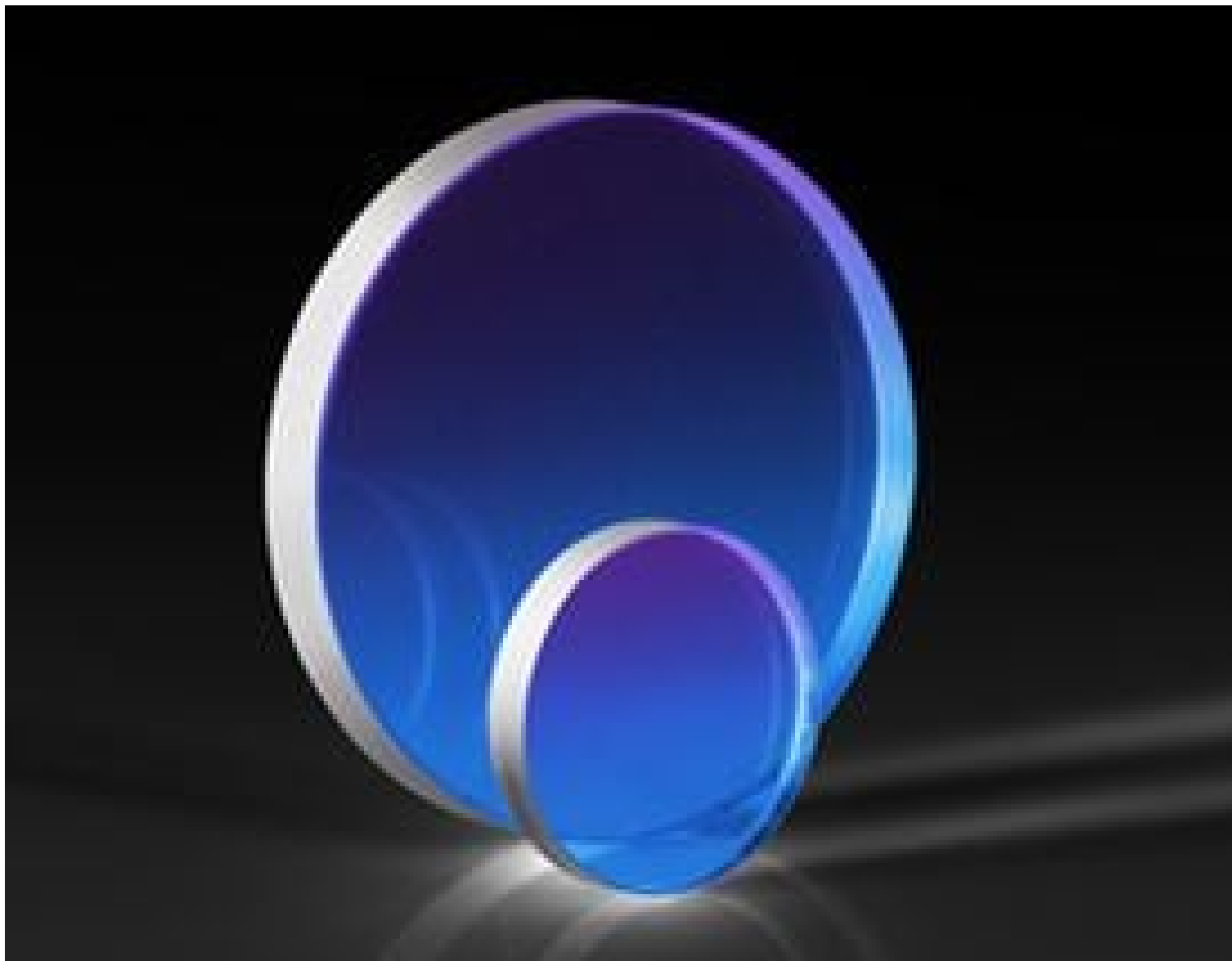
Magnesium Fluoride (MgF 2 ) Windows