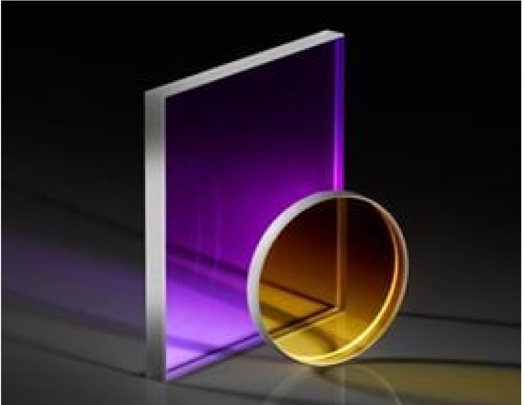
TECHSPEC® 1λ UV Fused Silica Windows