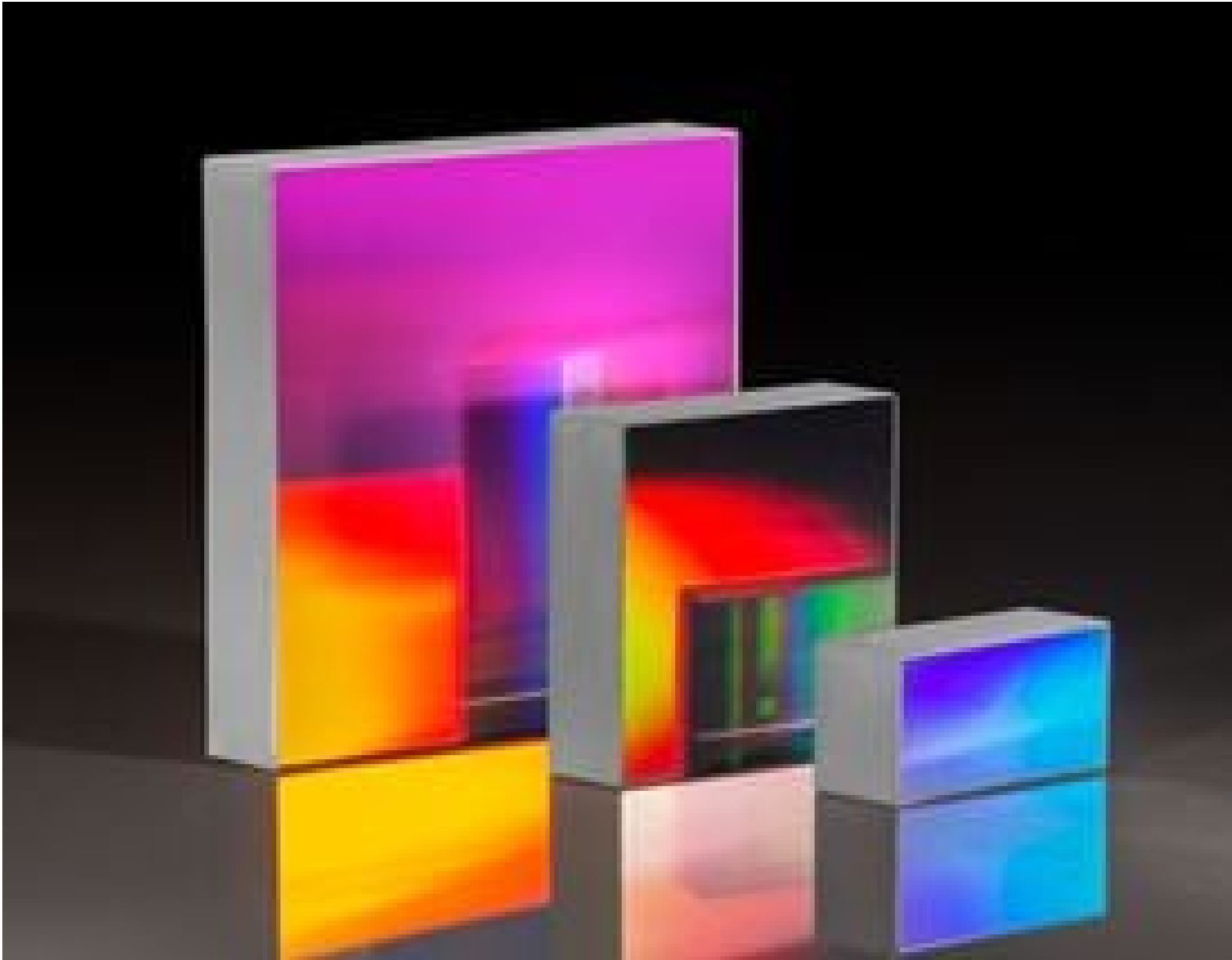
Reflective Ruled Diffraction Gratings