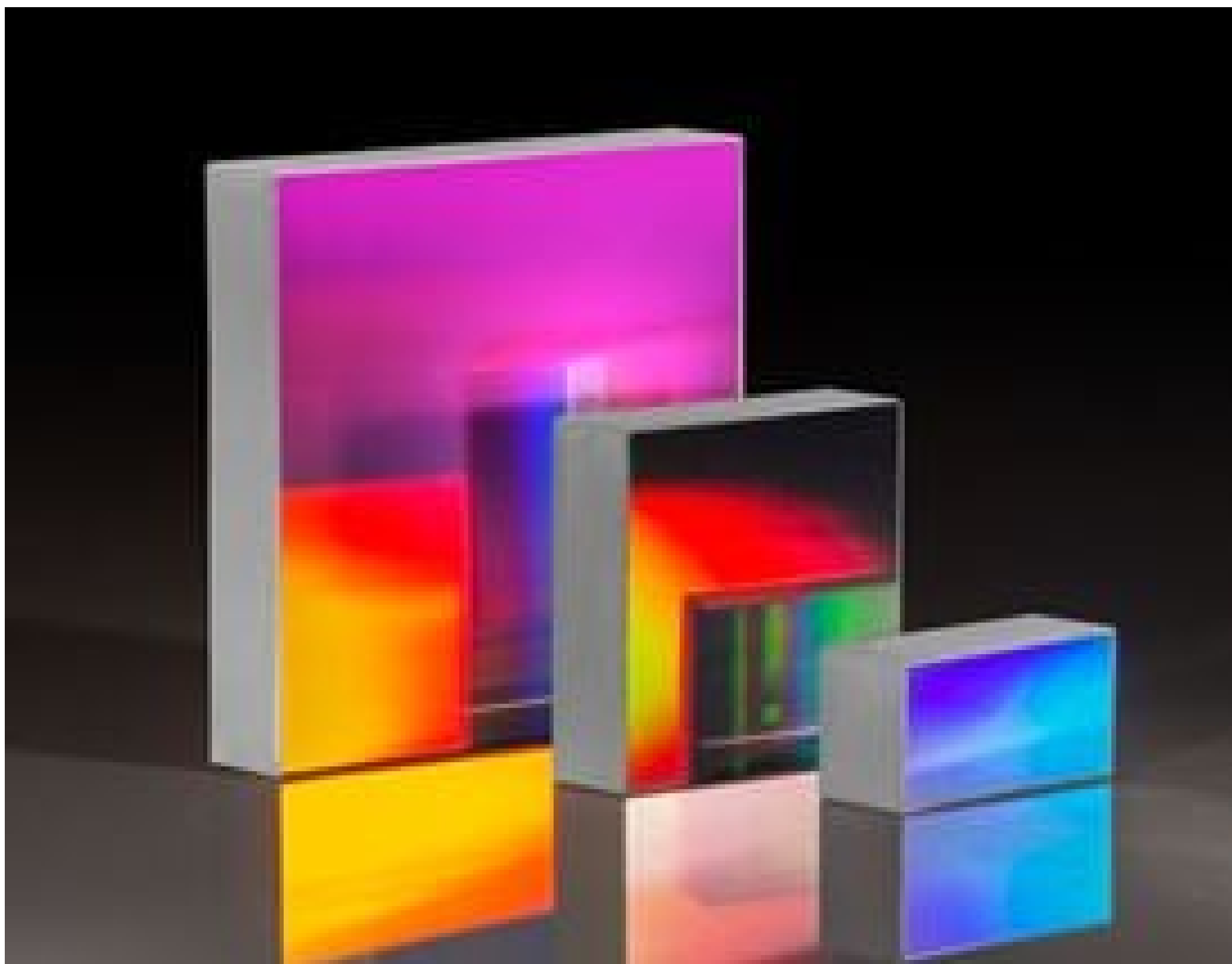
Reflective Ruled Diffraction Gratings