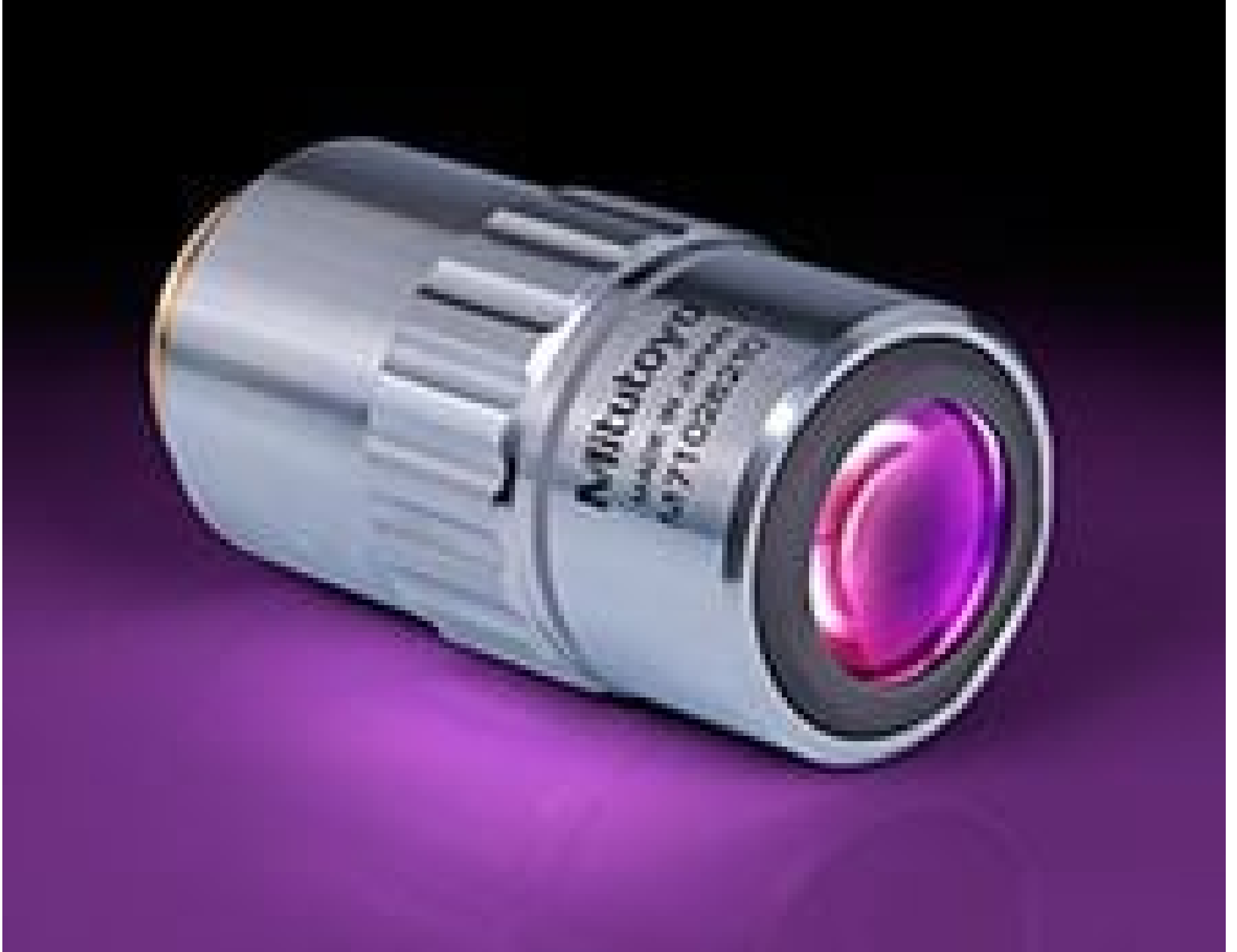
2X Mitutoyo Plan Apo Infinity Corrected Long WD Objective, #46-142