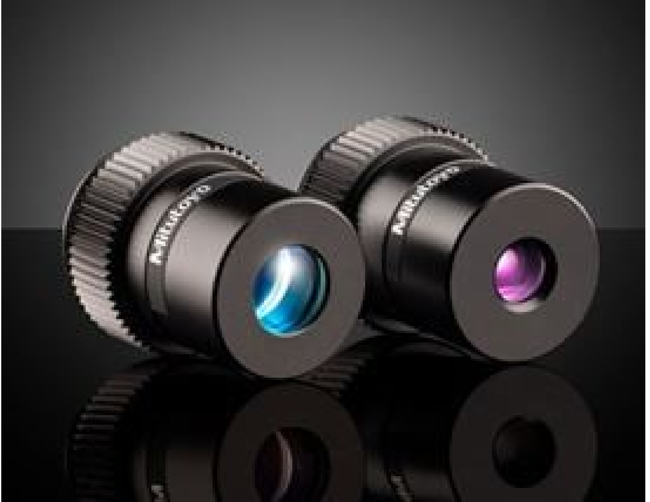
Mitutoyo Compact Objectives