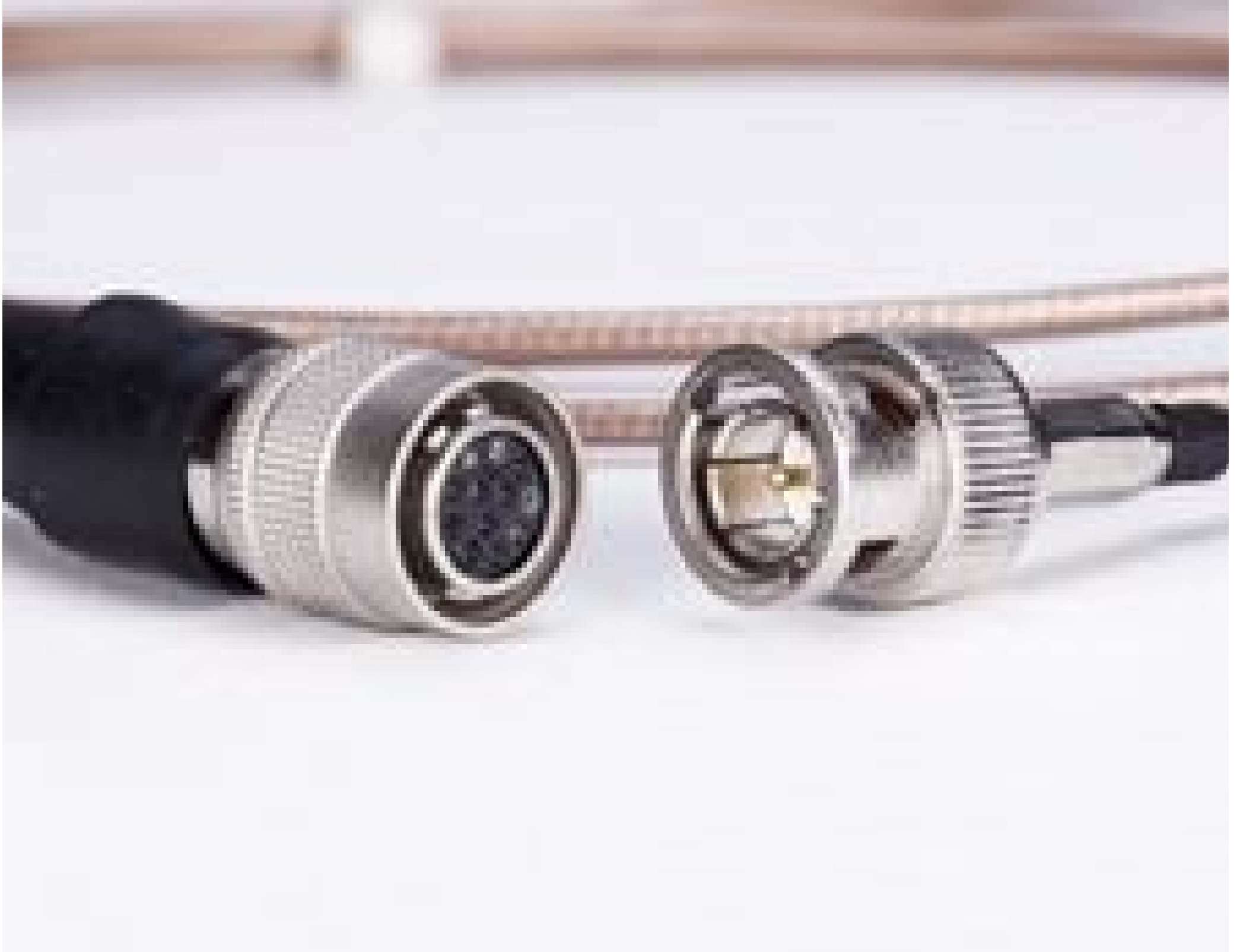
2m Trigger Cable with BNC Connector, #88-367