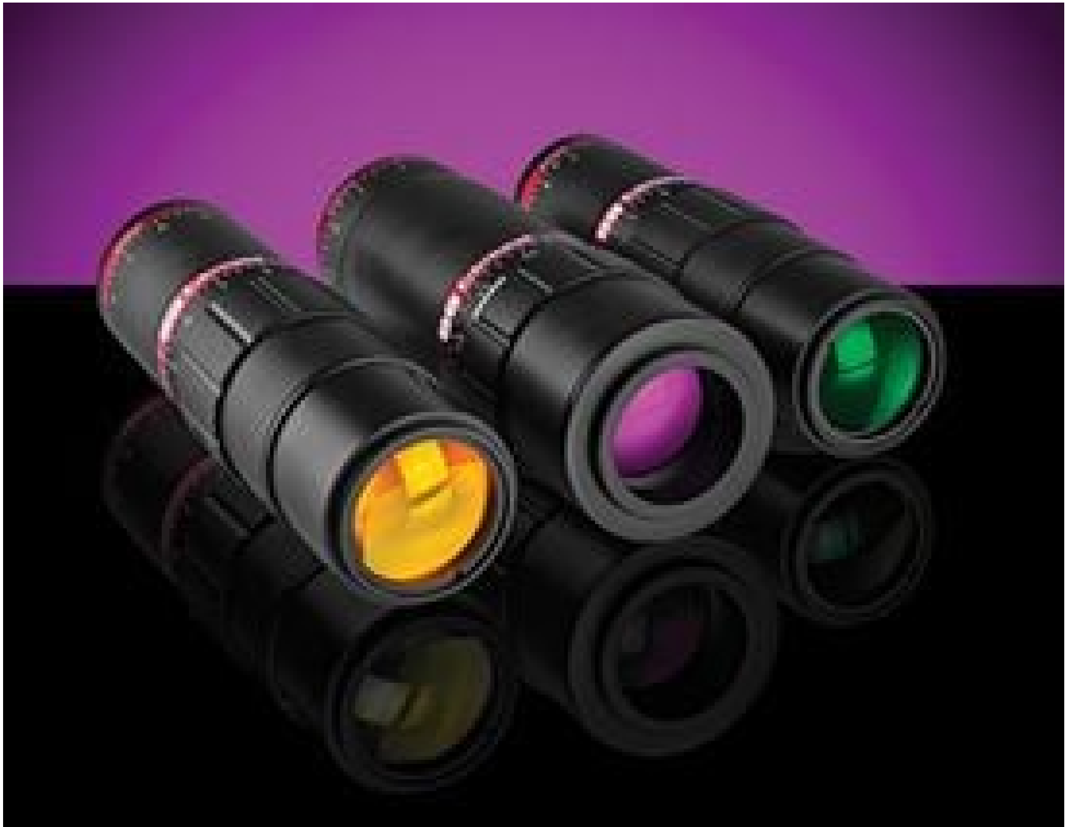
Research-Grade Variable Beam Expanders