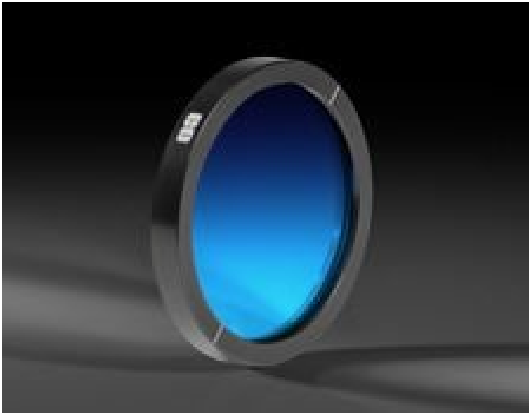
Mounted Ultra Broadband Wire Grid Linear Polarizer