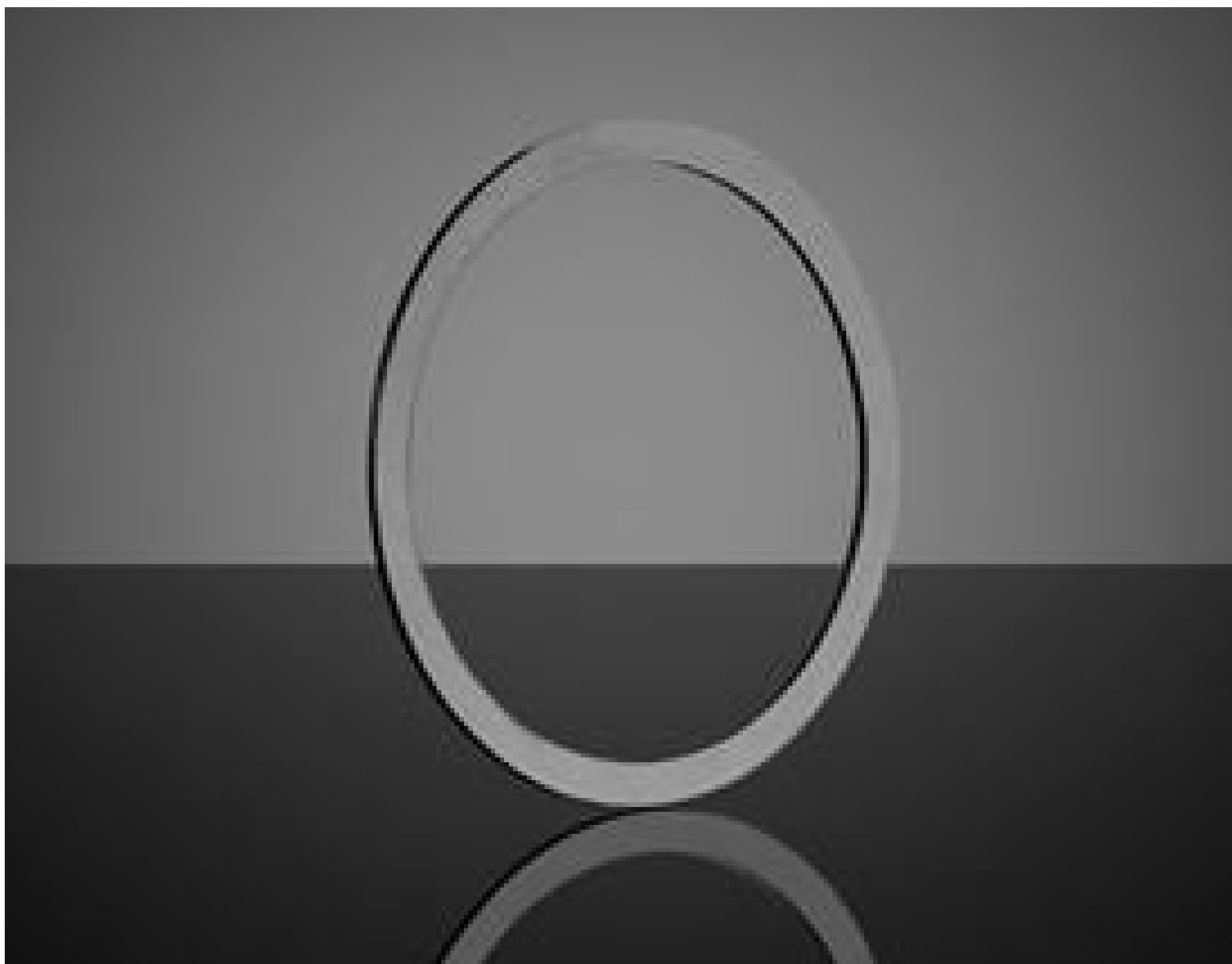
TECHSPEC Multi-Element Spacer Ring