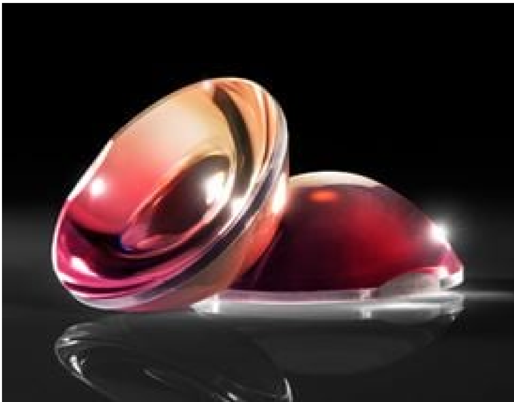
TECHSPEC® Plastic Aspheric Lenses